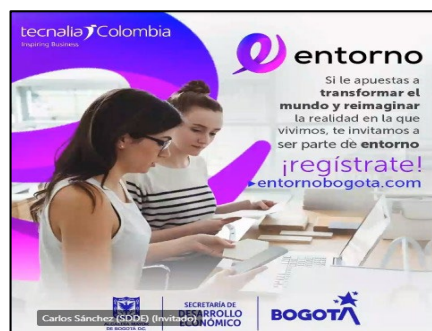
Imágenes 5 y 6. Convocatoria al programa “Entorno”.