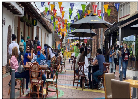
Imágenes 7 y 8. Programa “Bogotá a cielo abierto”.