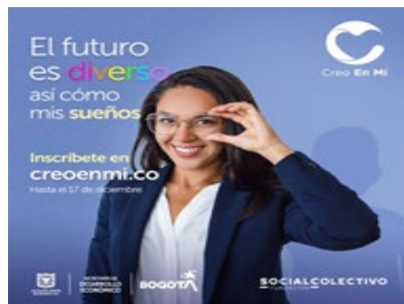
Imágenes 1 y 2. Convocatoria al programa “Creo en Mi”.