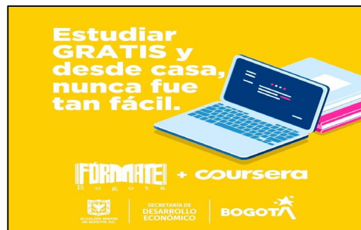
Imágenes 23 y 24. Convocatorias a cursos de formación para el trabajo.