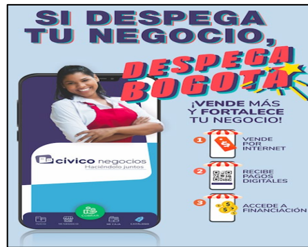
Imágenes 15 y 16. Convocatoria al programa “despega Bogotá”.