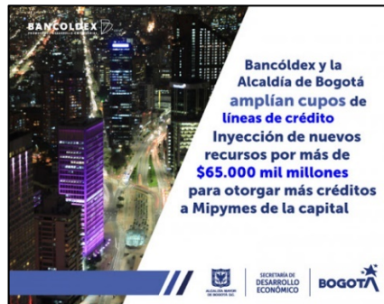
Imágenes 9 y 10. Programa “Bogotá responde”.