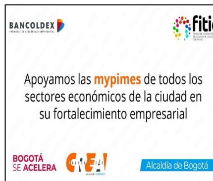
Imágenes 11 y 12. Programa “Crea Bogotá Crece”.