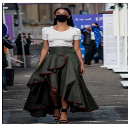
Imágenes 19 y 20. Convocatoria al programa "Moda y diseño 4.0".