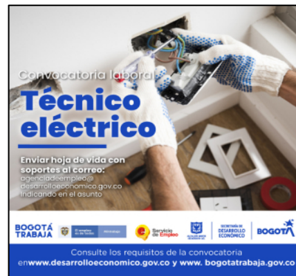
Imágenes 21 y 22. Ruta de empleo, y convocatorias laborales.