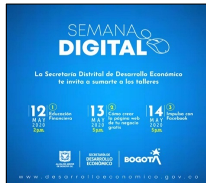
Imágenes 13 y 14. Convocatoria talleres de educación financiera.