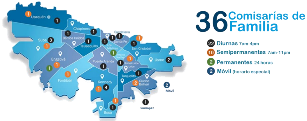
Ilustración 1. Esquema gráfico distribución geográfica de las Comisarías de Familia

En general, por localidad las Comisarías se encuentran distribuidas de la siguiente manera: