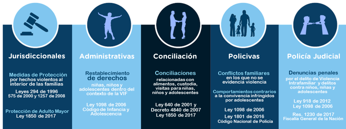
Ilustración 3. Competencias de las Comisarías de Familia

El primer nivel , asociado a la recepción inicial del usuario, busca delimitar la demanda inicial del servicio en función de su competencia funcional y territorial, pues las Comisarías de Familia operan en función de un conjunto de competencias que le determina la ley, estas son: