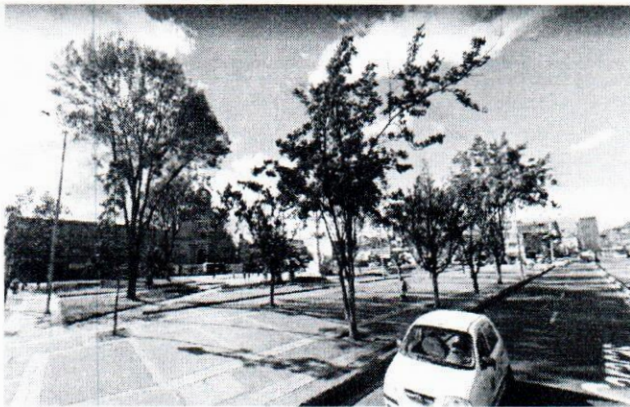
VISTA GENERAL - VISTA 1

Se realiza visita, con el fin de establecer la posibilidad de establecer una jardinera de 3000 metros cuadrados en la zona verde de la Plaza de los Mártires. Se anota que es posible construirla y que el diseño se adecúa a las condiciones físicas del lugar, se analizan las variables técnicas a considerar en la implementación y se adquiere información para realizar la programación de actividades.