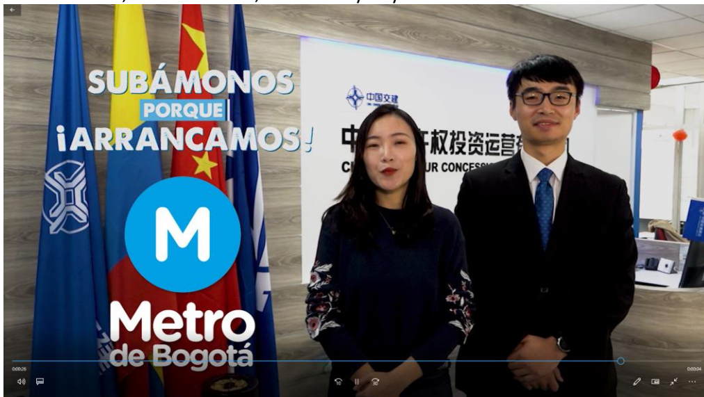
La producción del comercial la realizó la Alcaldía de Bogotá. Radio

28 repeticiones del mensaje institucional de 30" y 13 menciones de 10" programadas en espacios en horario prime en Caracol Televisión, RCN Televisión, Canal Uno y City TV.