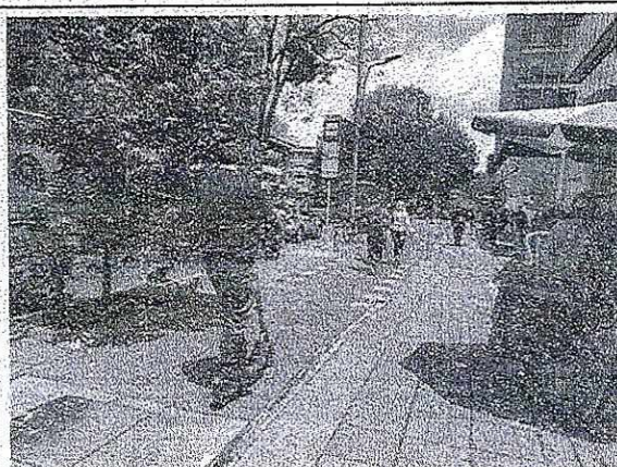
Fotografía 4. Panorámica Carrera 11 con Calle 90, vista al Sur.

Así mismo, se indica que conforme al Art. 109 de la Ley 769 de 2002 (CNTT), el cual se establece: "... Todos los usuarios de las vías están obligados a obedecer las señales de tránsito...", por lo tanto, aun cuando es responsabilidad de la Secretaría Distrital de Movilidad adoptar todas las medidas necesarias para garantizar la movilidad en condiciones de seguridad y comodidad a los usuarios, existe un deber de corresponsabilidad de los ciudadanos en el acatamiento de las normas.