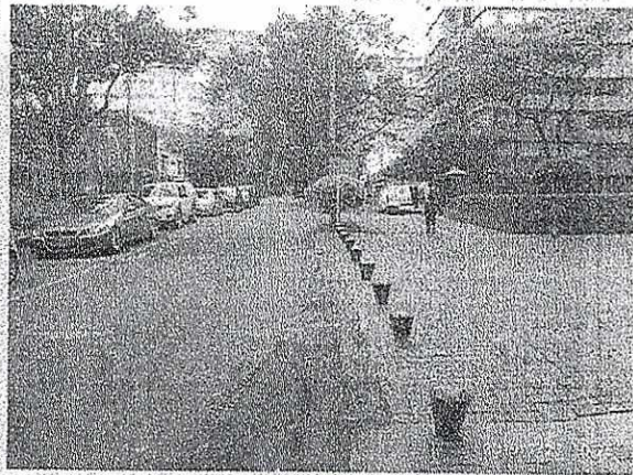
Fotografía 2. Panorámica Calle 85 con Carrera 10, vista al Oriente. Frente a edificio de la Calle 85 N° 10-11.

En cuanto al requerimiento allegado acerca de: “La ciclorruta en el andén de la carrera 11 entre calles 81 y 100 se sigue usando con gran riesgo para el peatón, no hay señalización” . Con el fin de dar respuesta y según las competencias de la Subdirección de Señalización se informa lo siguiente: