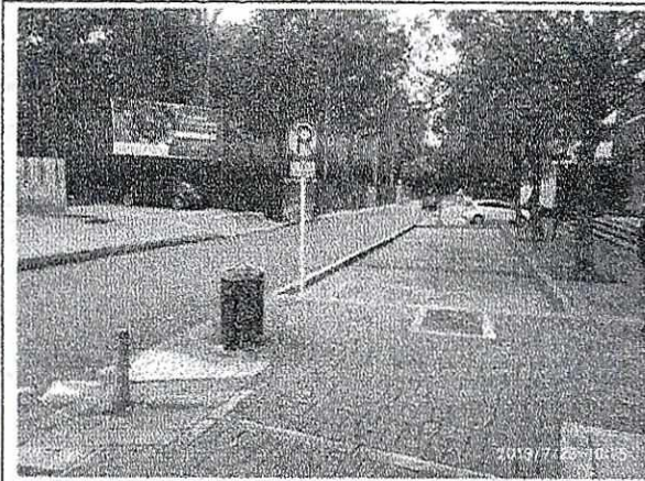
Fotografía 21. Panorámica Calle 87 con Carrera 11, vista al Occidente.

Sin embargo, dentro de las recomendaciones a tener en cuenta en la propuesta se estableció entre otras, la siguiente: "1. Elevar consulta a la Secretaría Distrital de Planeación sobre la viabilidad normativa para la modificación del perfil vial de la KR 11A entre CL 86A y CL 87". En este sentido, dentro de las observaciones emitidas por la Subdirección de Señalización en la revisión de la propuesta del diseño de señalización (oficio SDM-SS-108094-19 del cual se adjunta copia) se reiteró la solicitud de presentar el concepto emitido por la Secretaría Distrital de Planeación sobre la propuesta de adecuación de la Carrera 11A entre Calle 87 y Calle 86A.