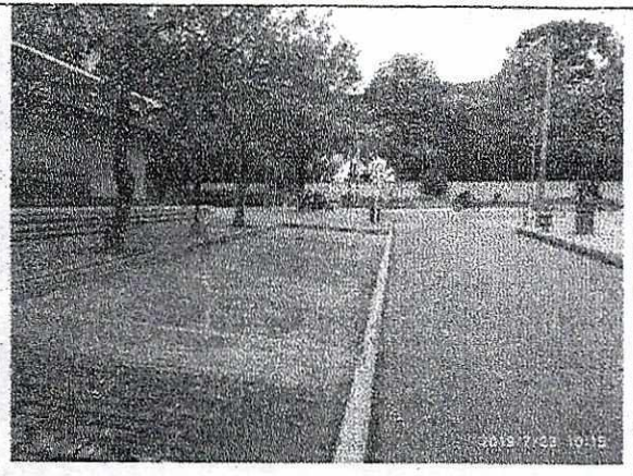
Fotografía 22. Panorámica Calle 87 con Carrera 11, vista al Oriente.