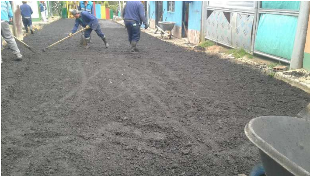
Conformación del material freado estabilizado.