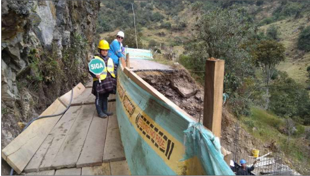
Manejo del trnsito peatonal y señalización