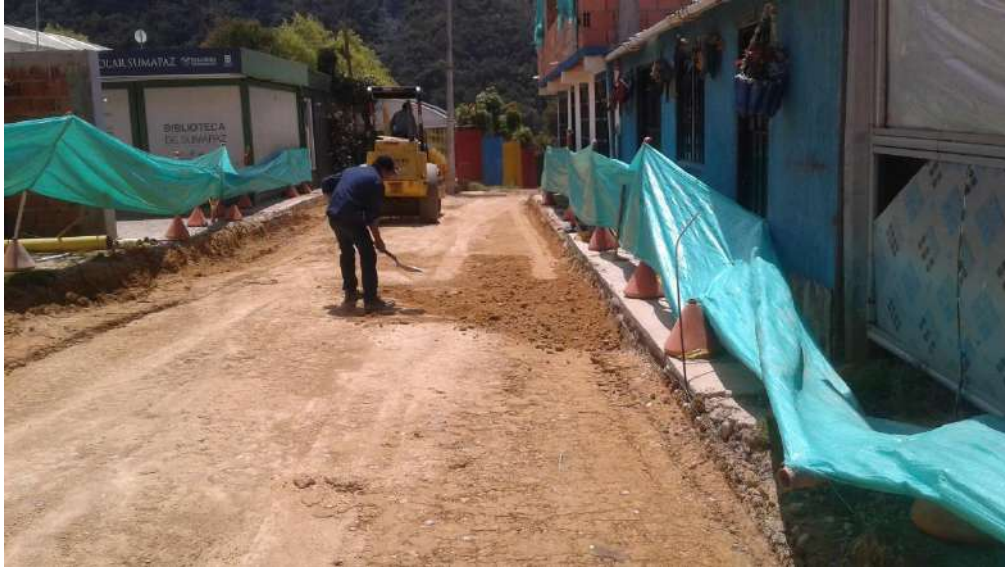
Compactación del amterial b-400