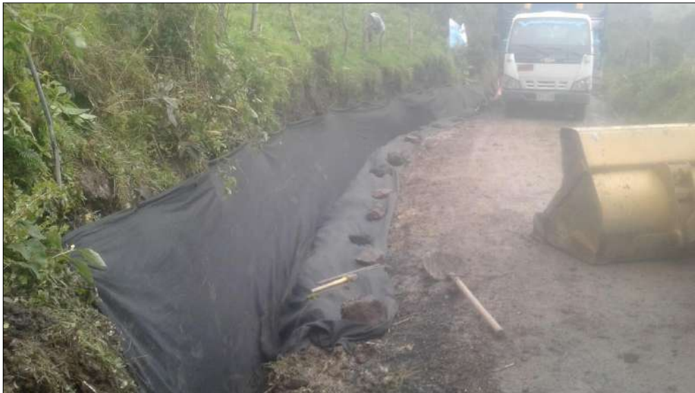
Instalación de geotextil y tubería de drenaje.