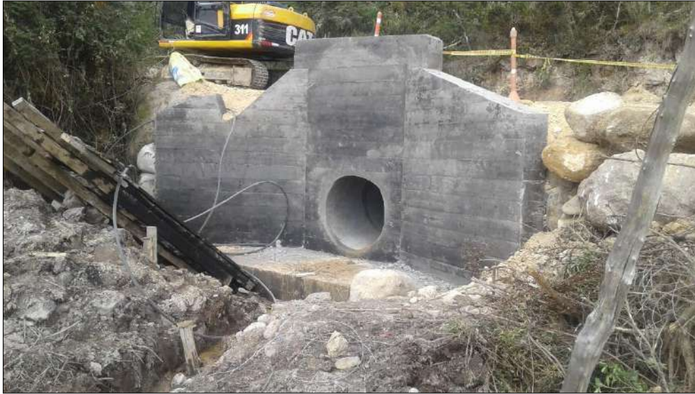
Alcantarilla N°3 descole