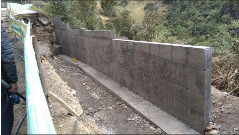
Muro de contención finalizado