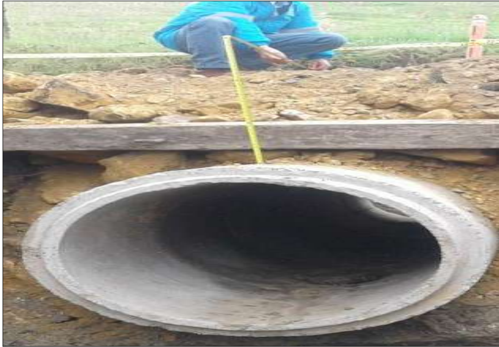
Medición del relleno Raizal hacia Une-peñaliza