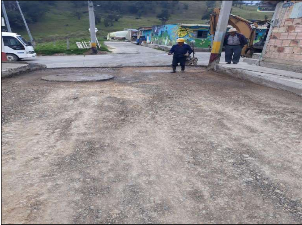
Nivelación, humedecimiento y compactación