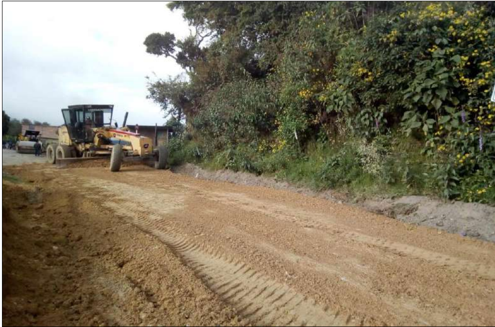
Extendido y nivelación Subbase B200.