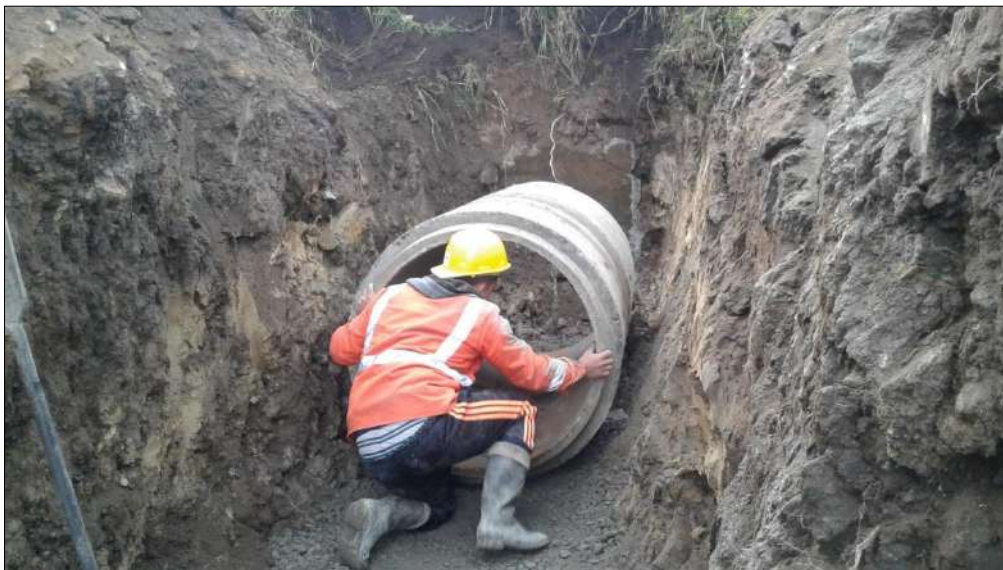
Instalación de tubería en concreto de 36" Raizal hacia Une-peñaliza