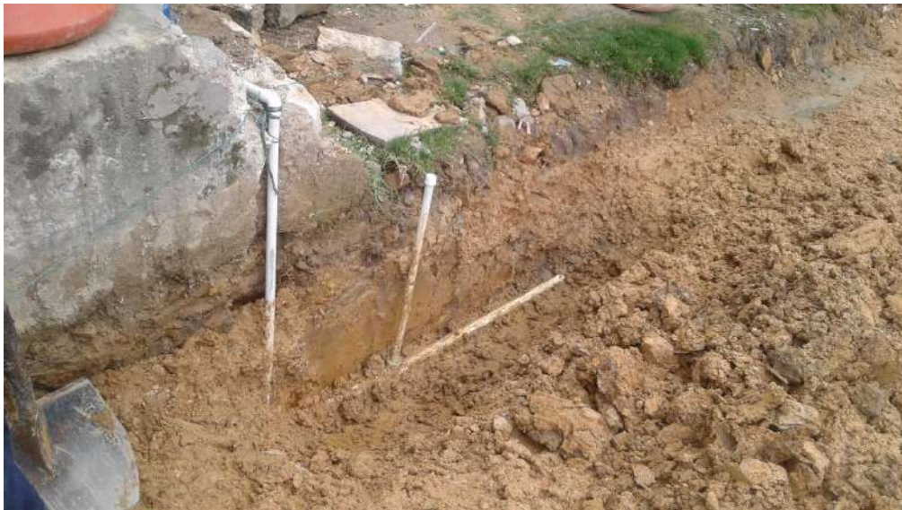
Las acometidas mal instaladas por parte de la comunidad