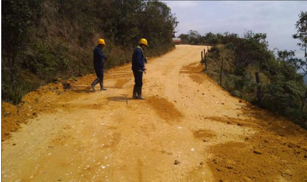
Recolección del material de los linderos.