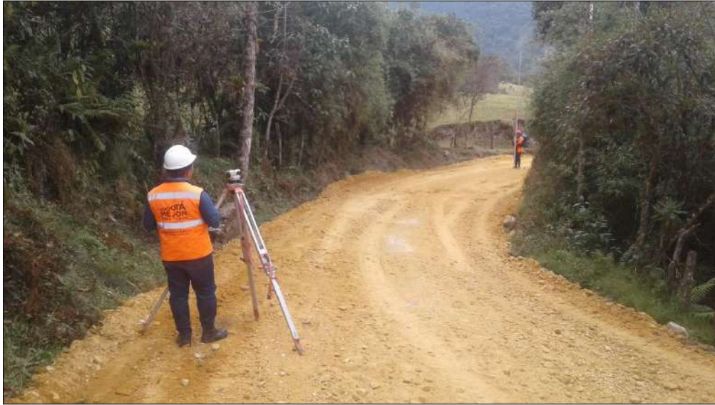
Niveles-Comisión de topografía.