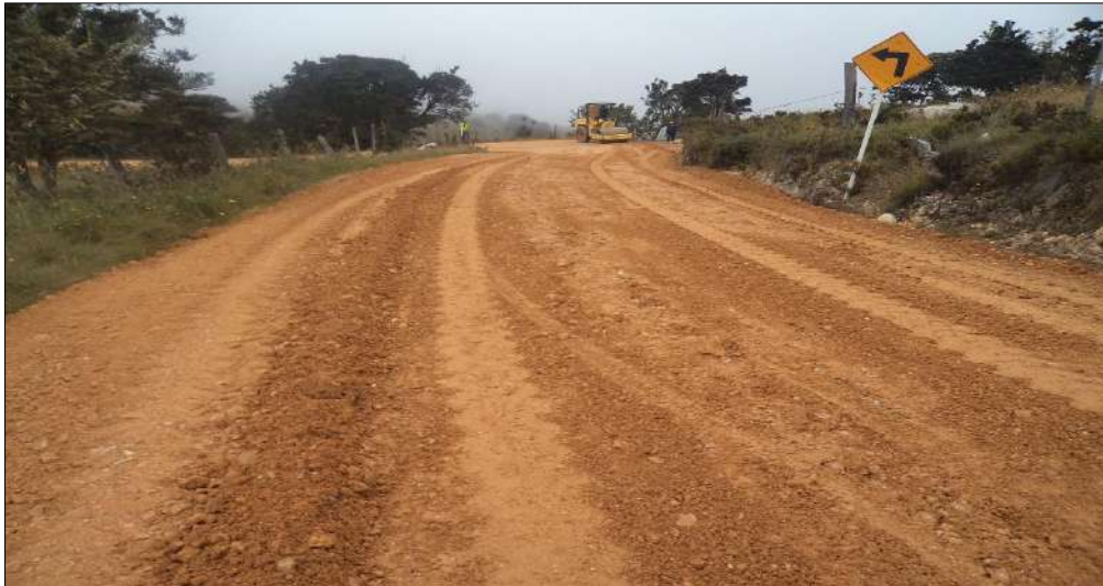
Extendido y nivelación Subbase B-400