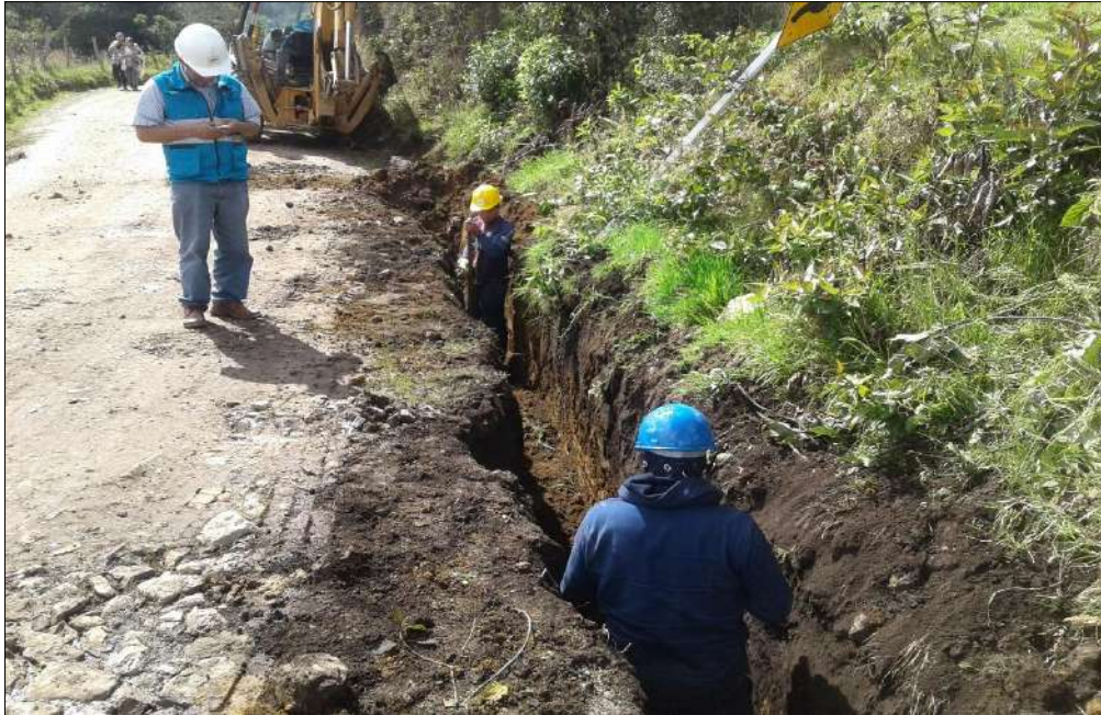
Excavación para los filtros