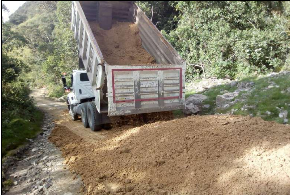
Transporte de materiales.