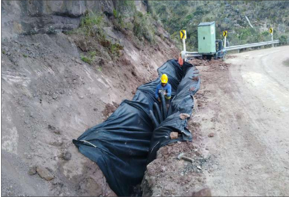
Instalación de geotextil y tubería para los filtros