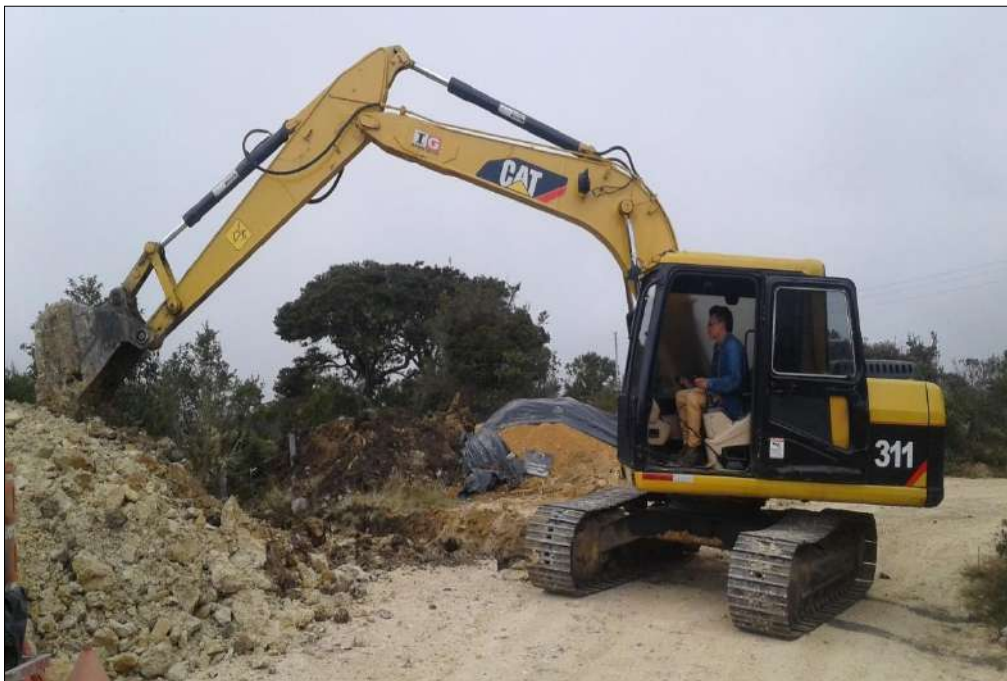
Excavaciones para las alcantarillas.