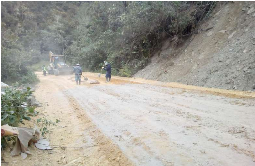
Estabilización del material B-400.