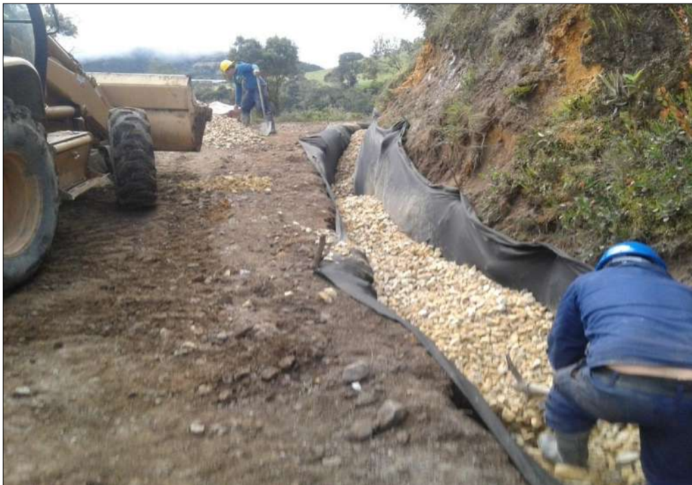
Instalación de material filtro