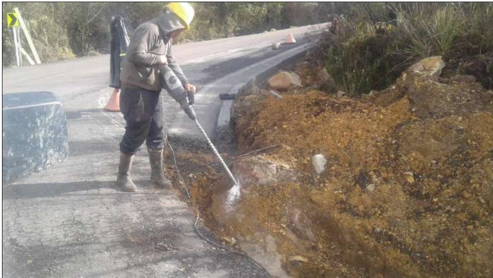
Demolición de roca.