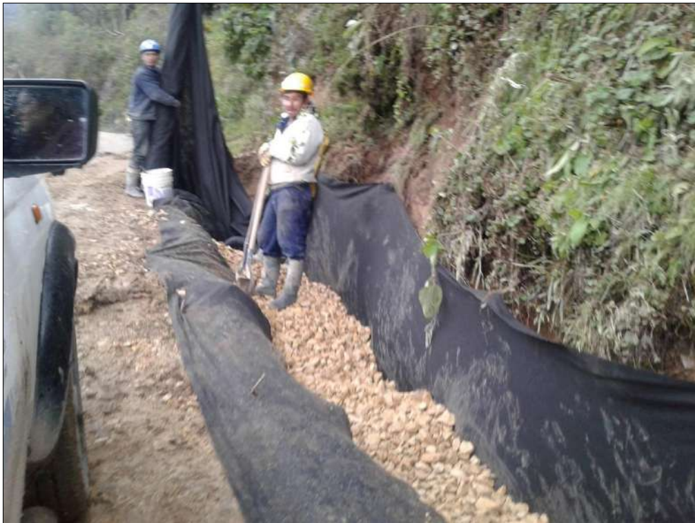
Instalación de material filtro.