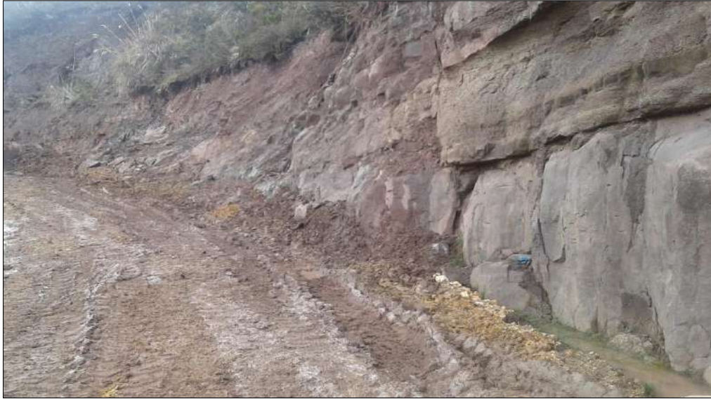
Extendido y nivelación Subbase B200.