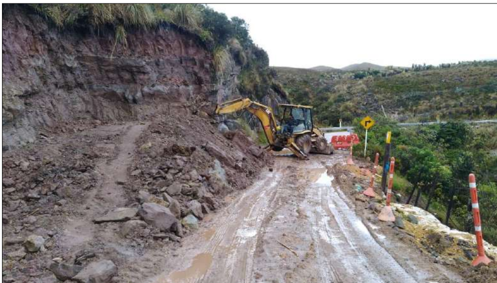
Extendido y nivelación Subbase B200.