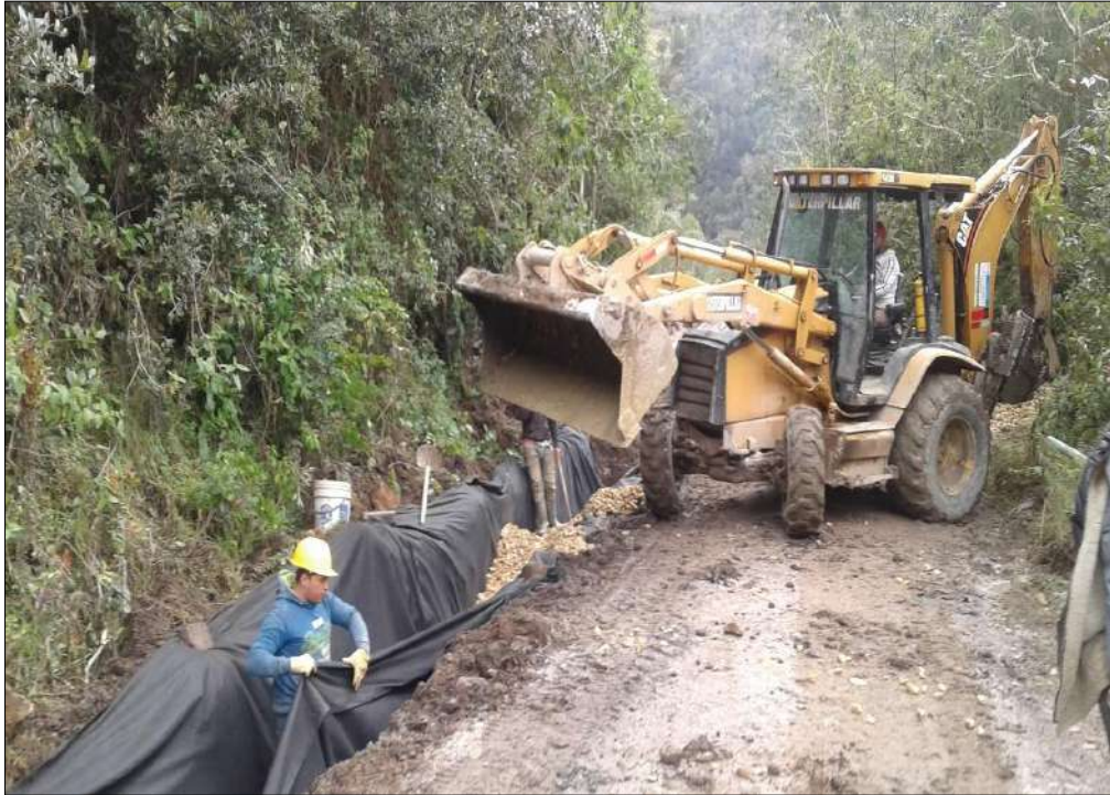
Instalación de geotextil y llenado con material filtro.