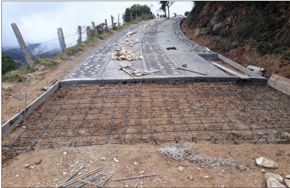
Figurado y armado del acero de refuerzo. Rampas placa huella.