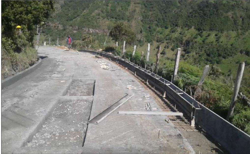
Cuneta con bordillo