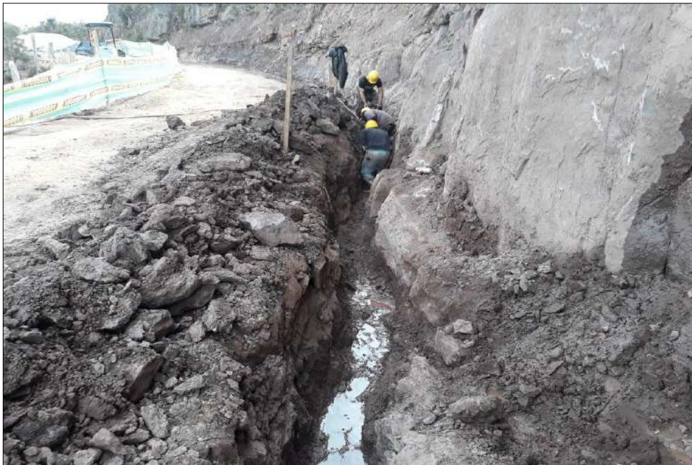
Excavación para los filtros