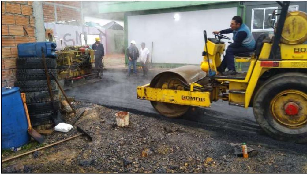
Compactación del material