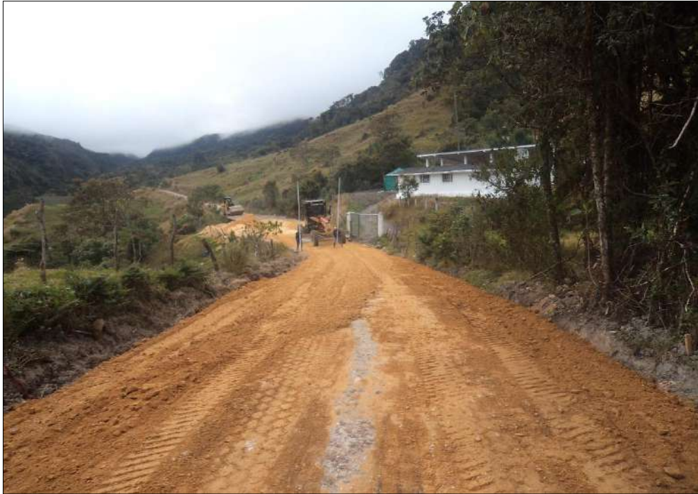
Extendido, nivelación de Subbase B200.