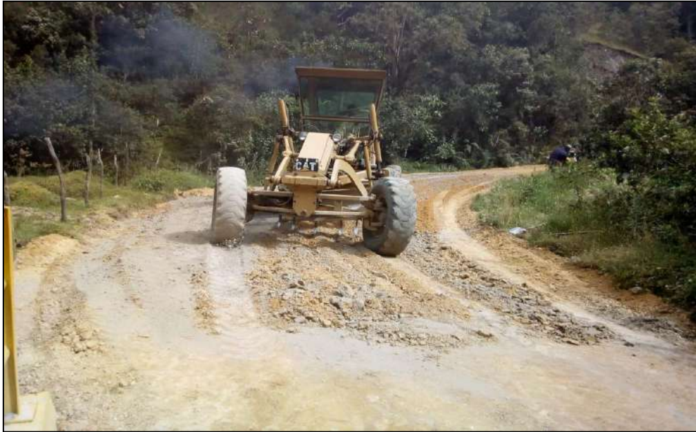
Extendido, nivelación y Mezclado con el cemento Subbase B-400.