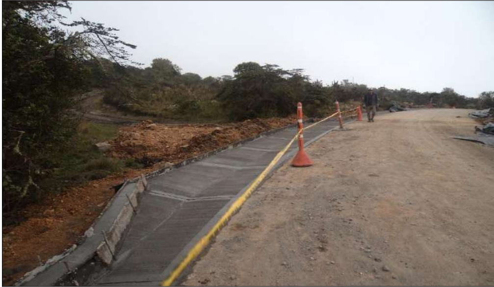
Fundido de cunetas