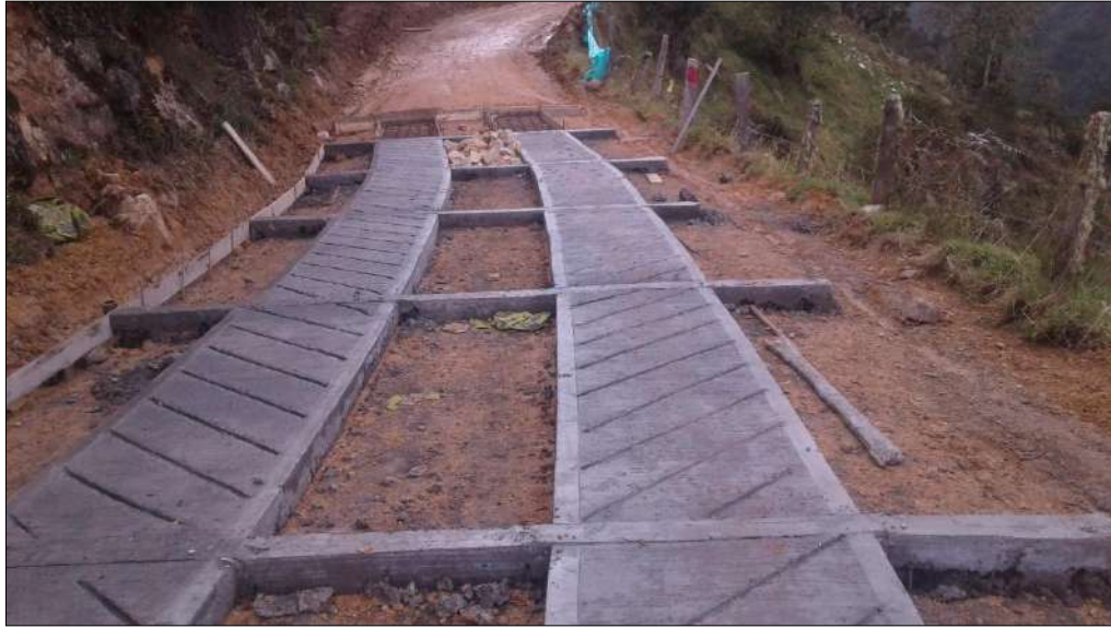
Concretos para las huellas y riostras