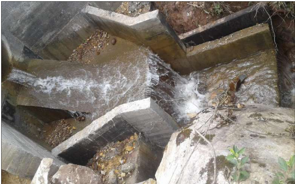
Funcionamiento de la alcantarilla con sisipador