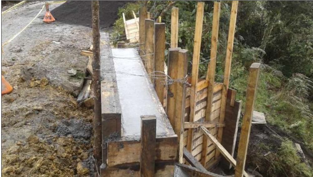
Fundido para las aletas