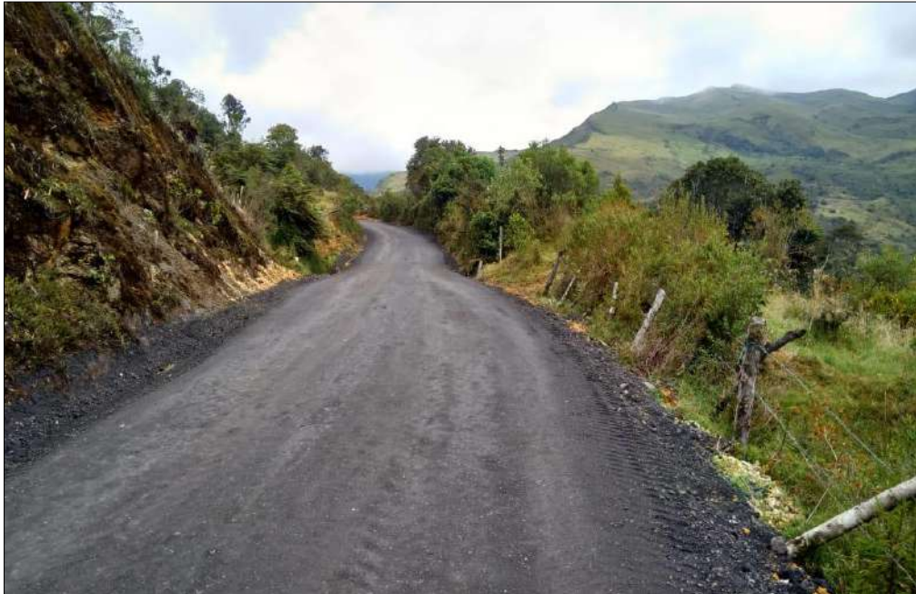
Material fresado estabilizado