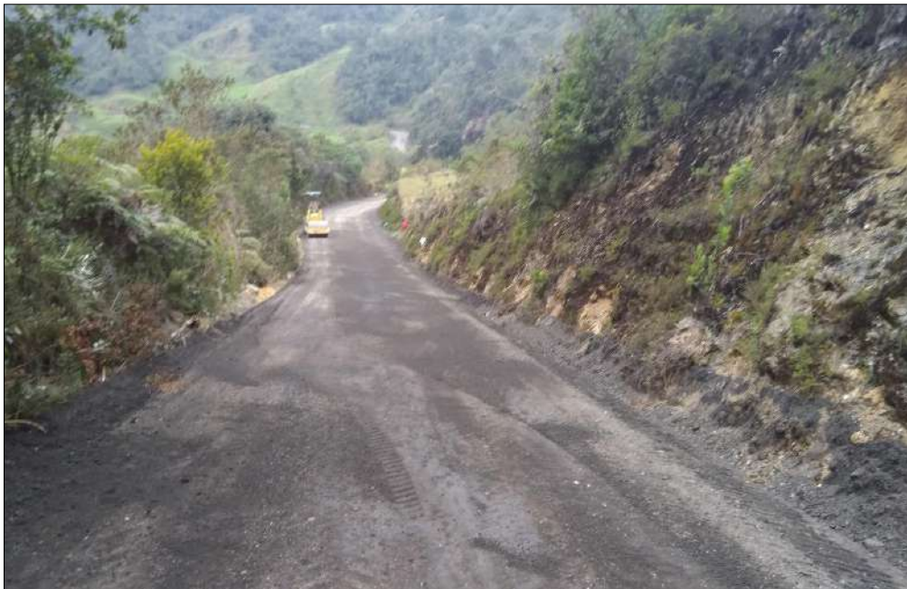
Extendido, nivelación y compactación de material fresado estabilizado