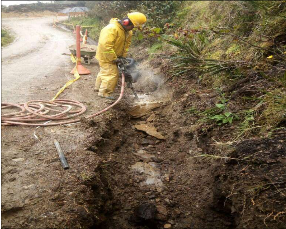
Excavación en roca (Demolición de las roca grandes )