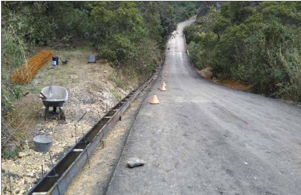
Encofrado para las cunetas