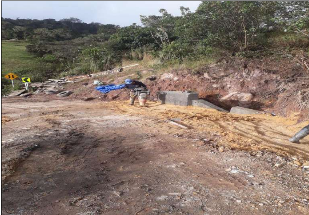
Rellenos y compactación