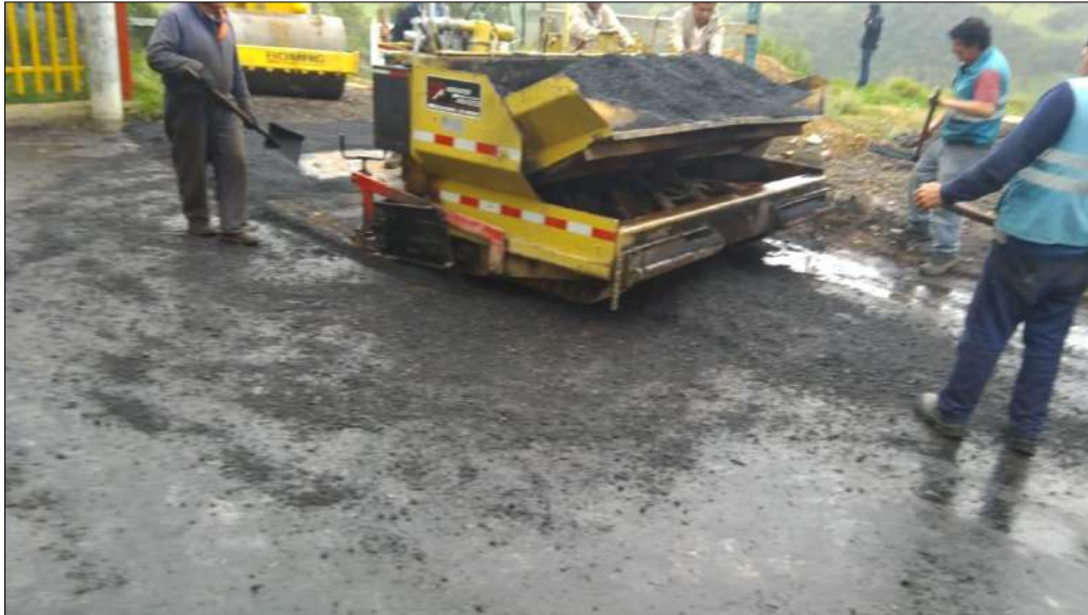
Instalación del la mezcla densa en caliente