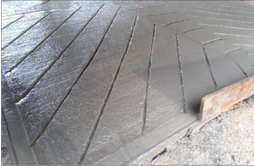
Rampa de acceso para la placa huella