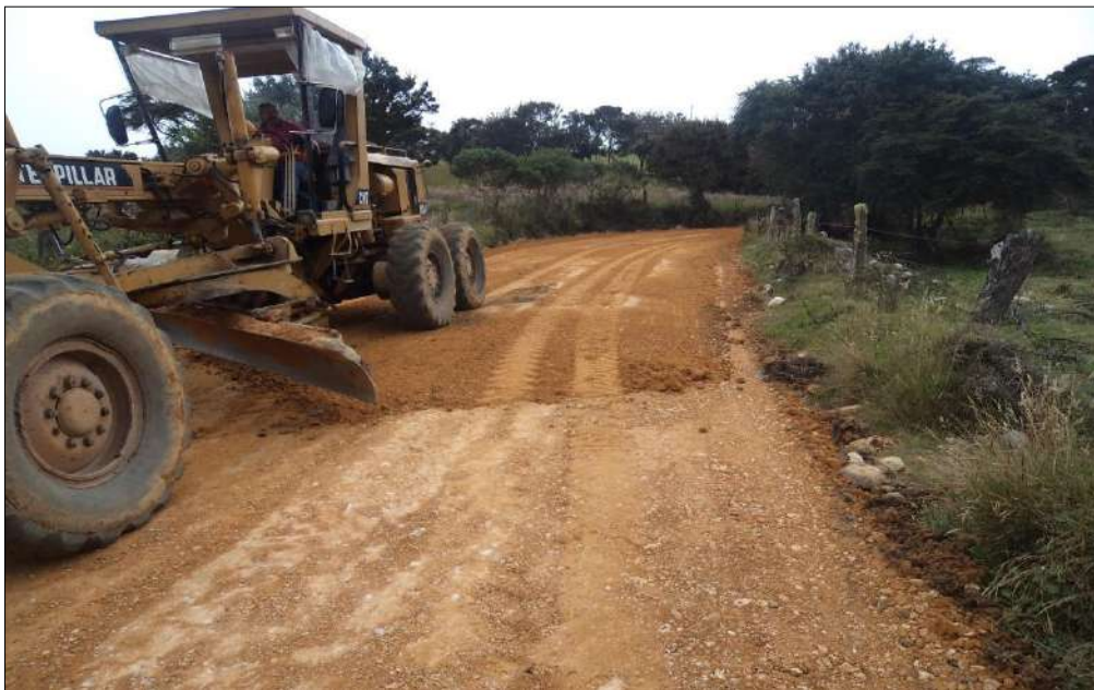
Extendido y nivelación Subbase B-400.