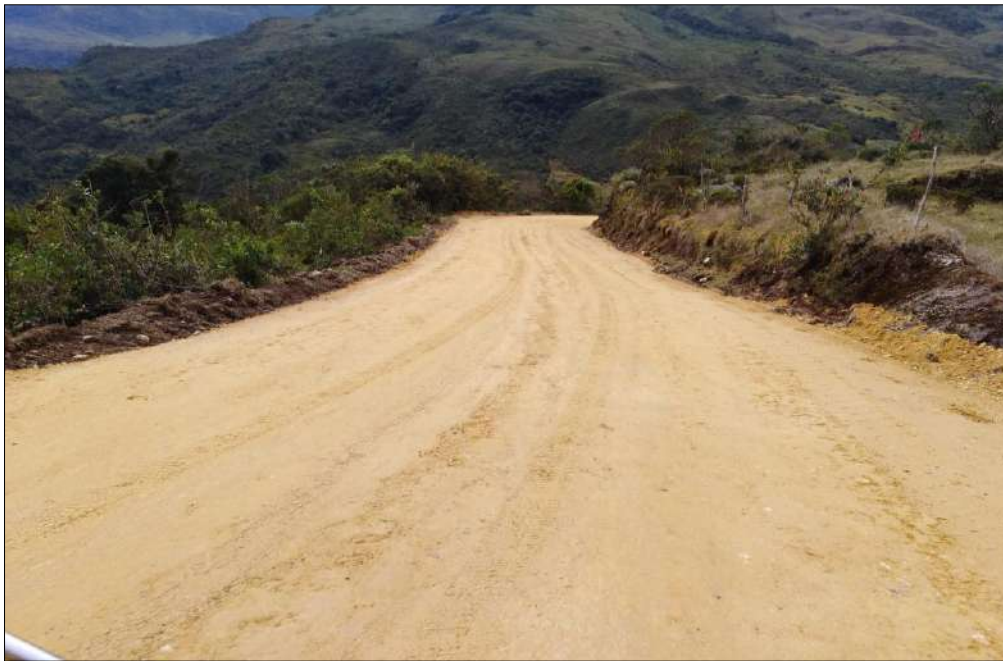
Estado final del material granular ya instalado