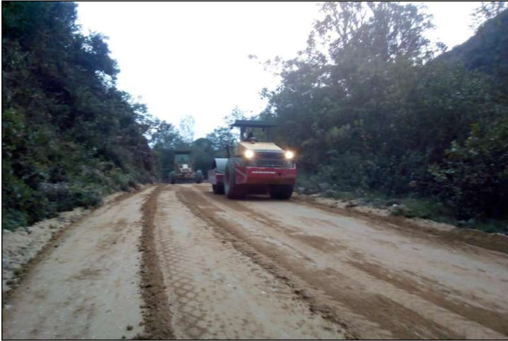
Compactación Subbase B-200.