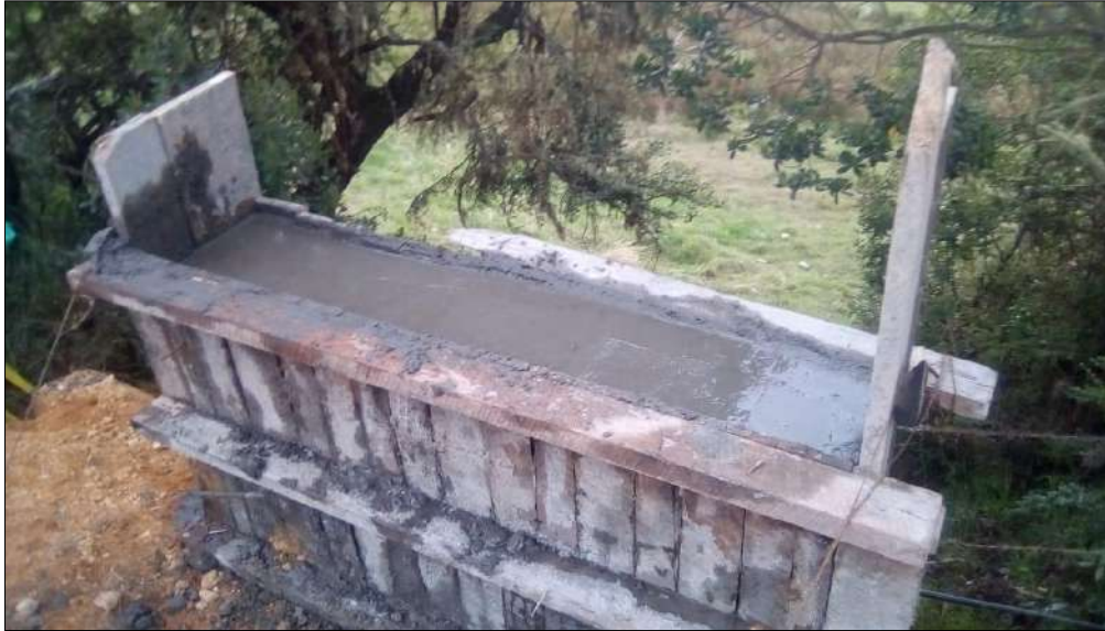
Realces de los cabezotes alcantarillas existentes