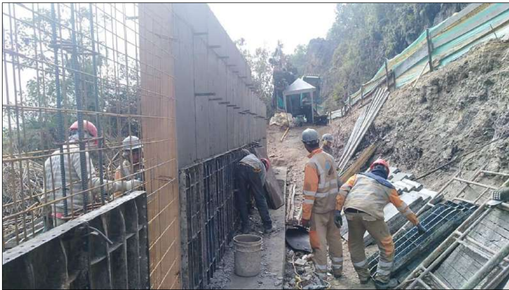
Armado de acero de refuerzo, Encofrado y fundido.