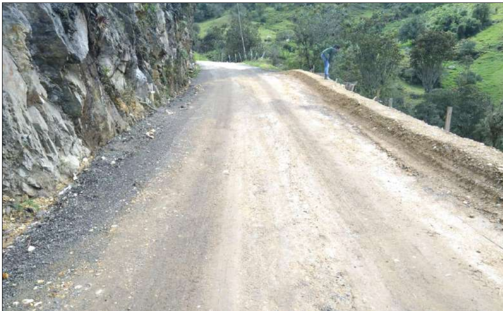
Jarillón en la zona del muro de contención