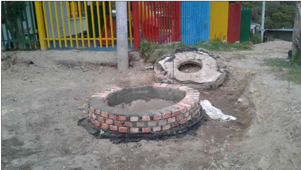
Realce de la caja de inspección