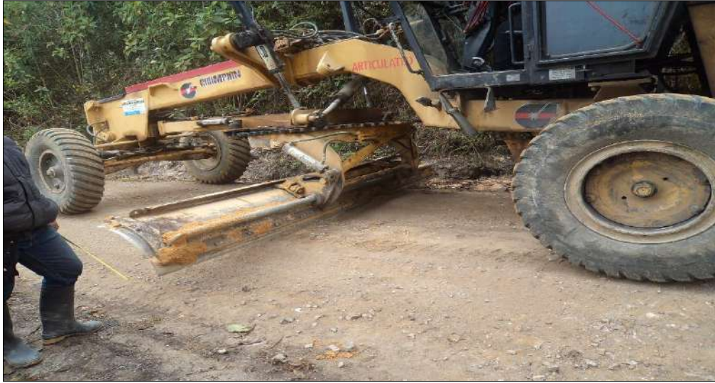
Nivelación de la subrasante