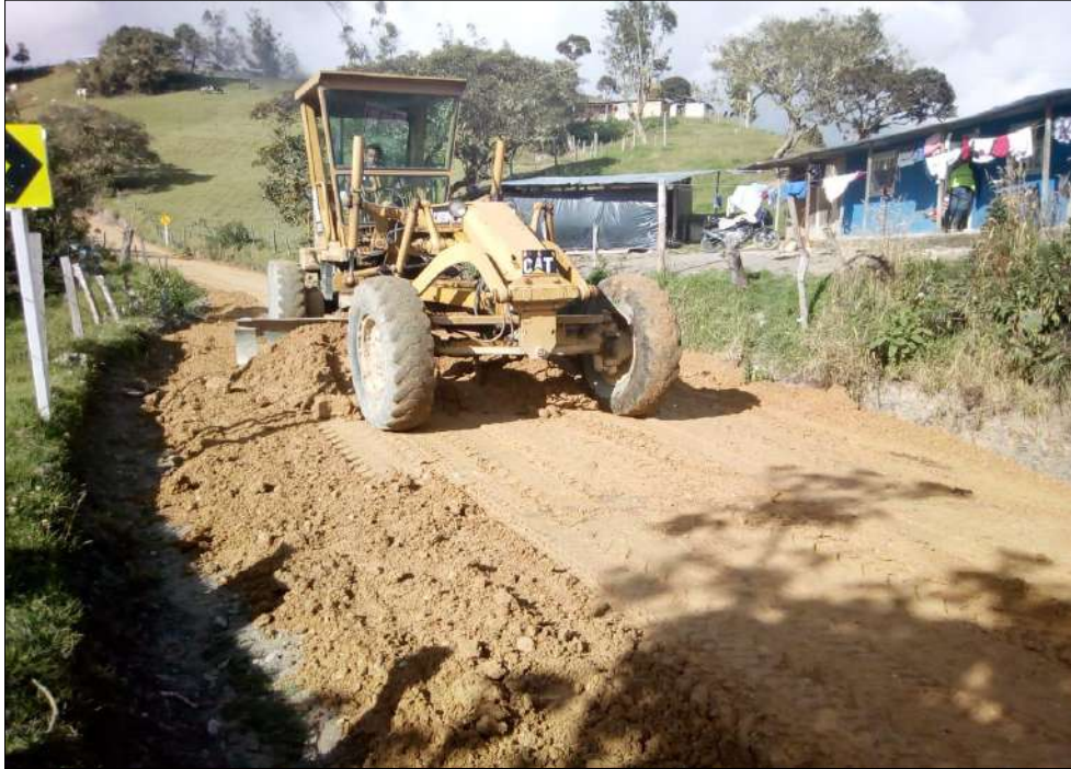
Extendido y nivelación Subbase B400.