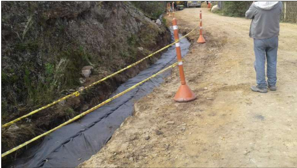
Cosido del geotextil.