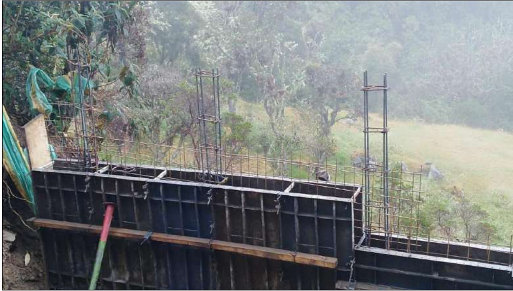
Acero de refuerzo