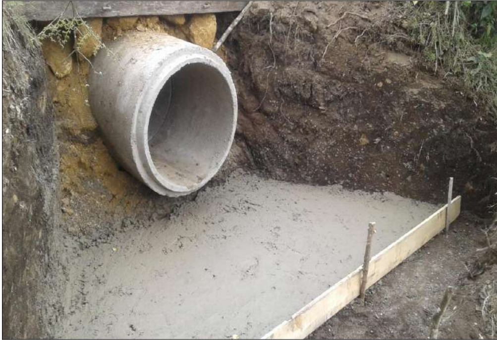
Solado salida alcantarilla-aletas