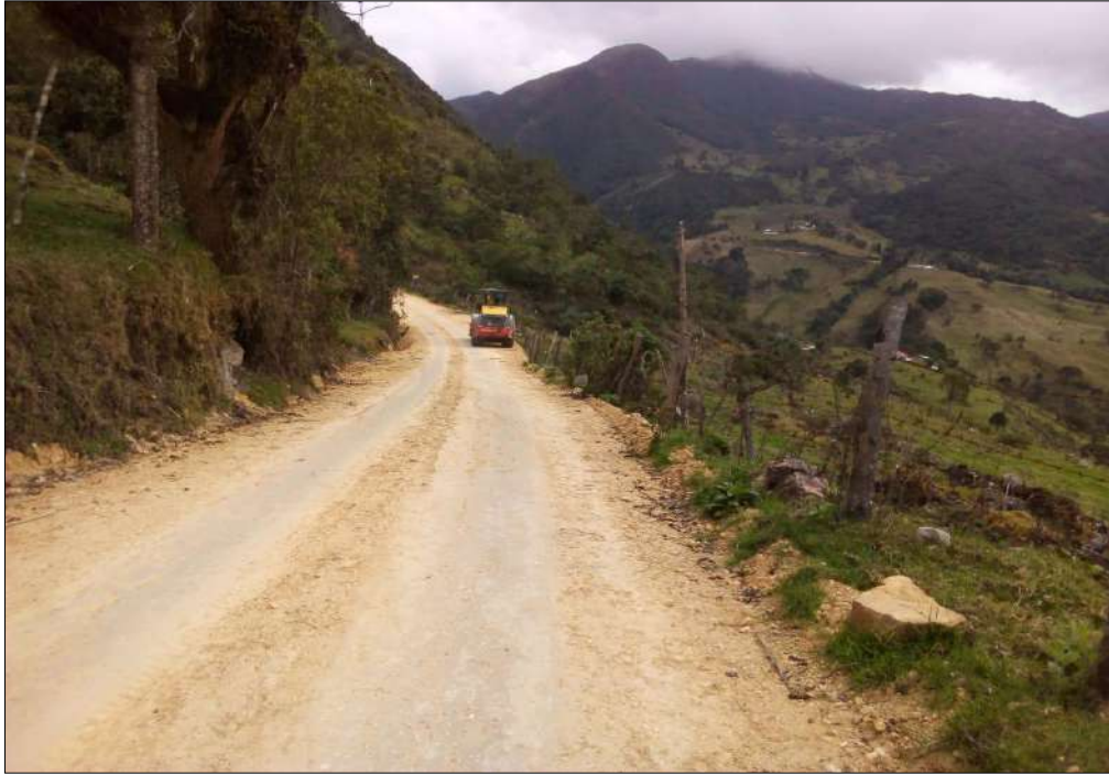
Compactación Subbase B-200.