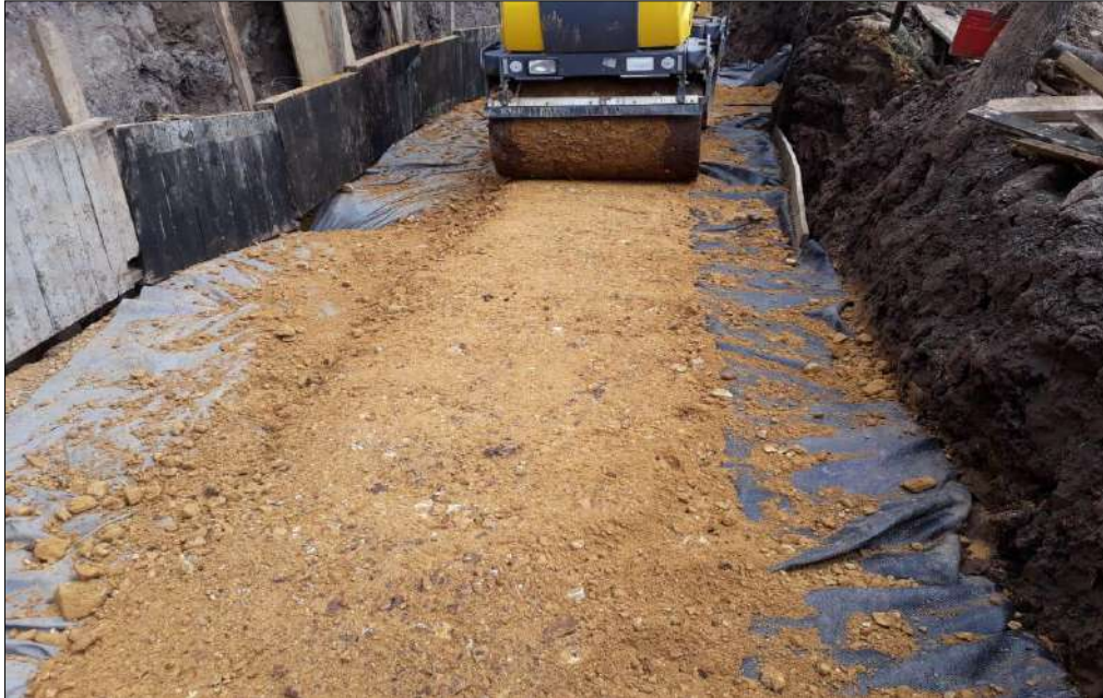
Instalación y compactación del material de relleno