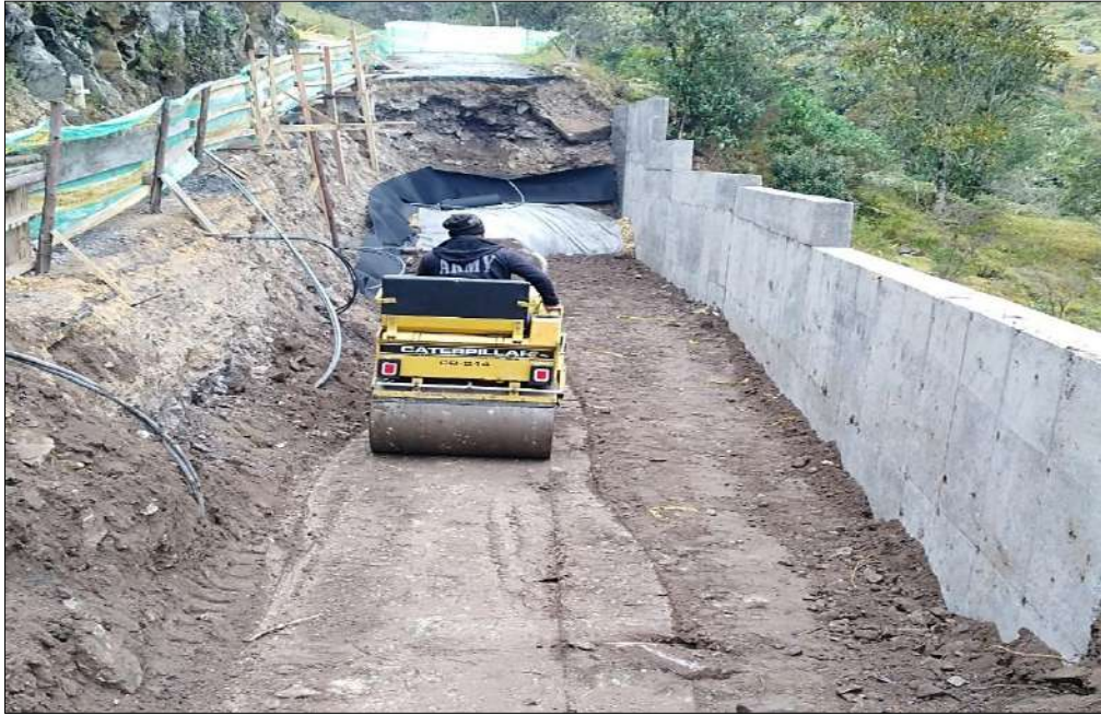
Compactación del material relleno