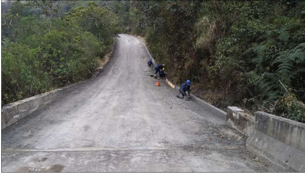
Fundido de cunetas y realces de cabezotes de alcantarillas existentes.