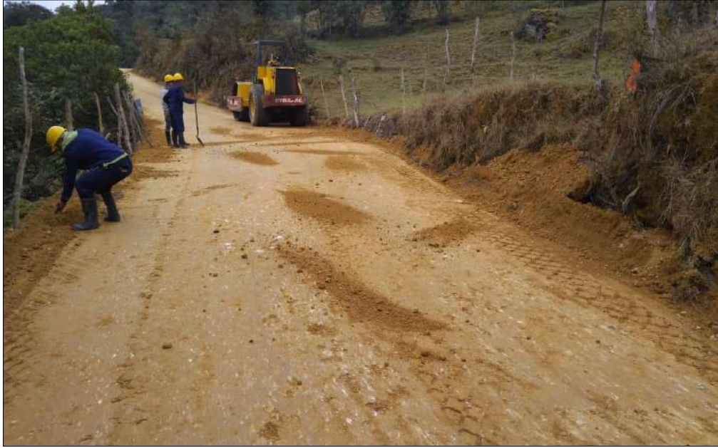
Recolección del material de los linderos.