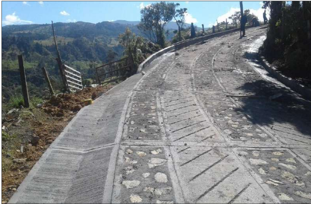
Se realiza cuneta en “v” para la entrada de una finca.