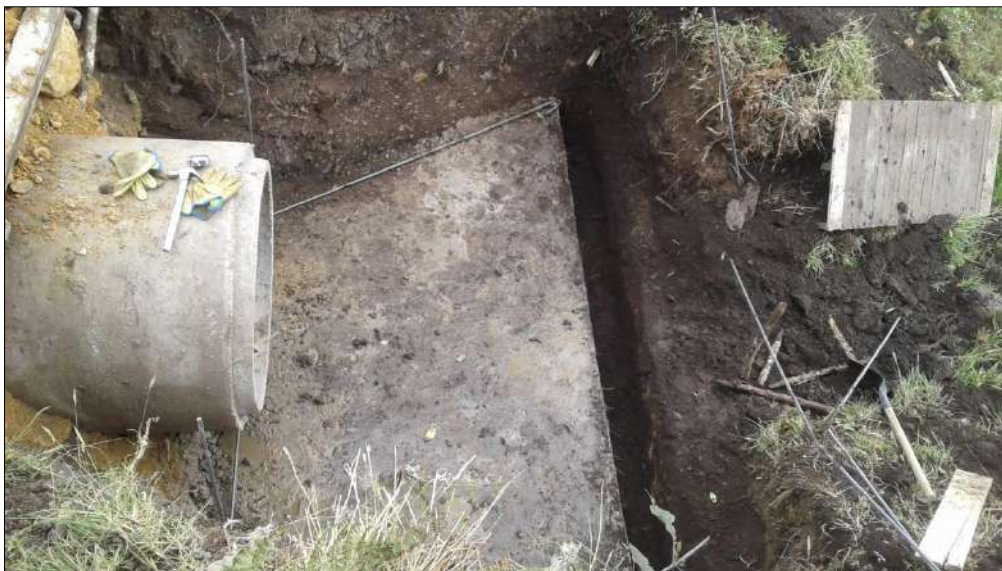
Excavación para llave de alcantarilla