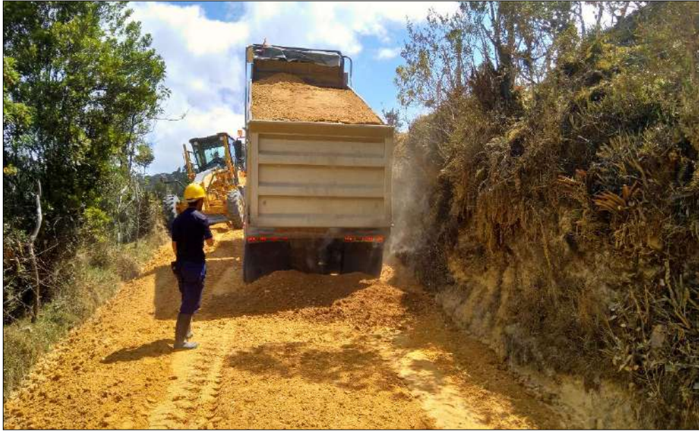
Transporte de materiales