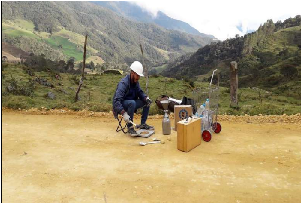
Toma de Densidades -Muestras para laboratorio.