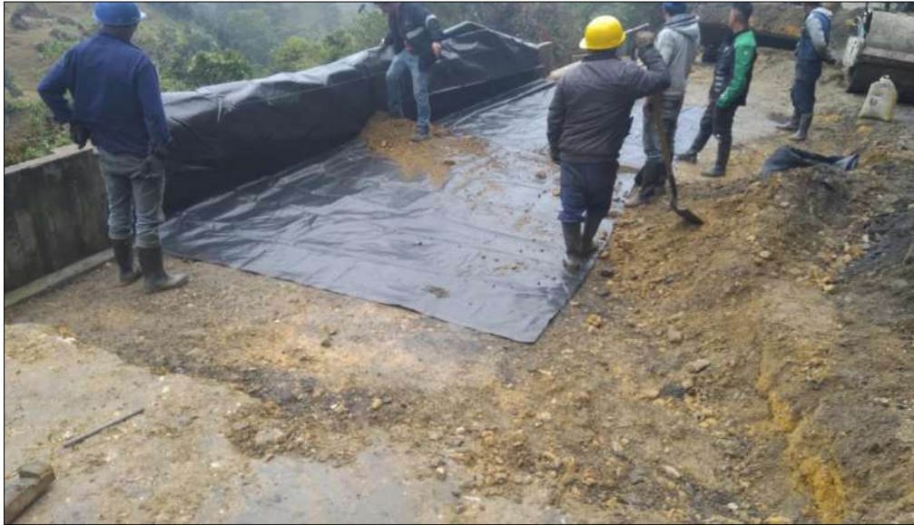
Instalación de geotextil