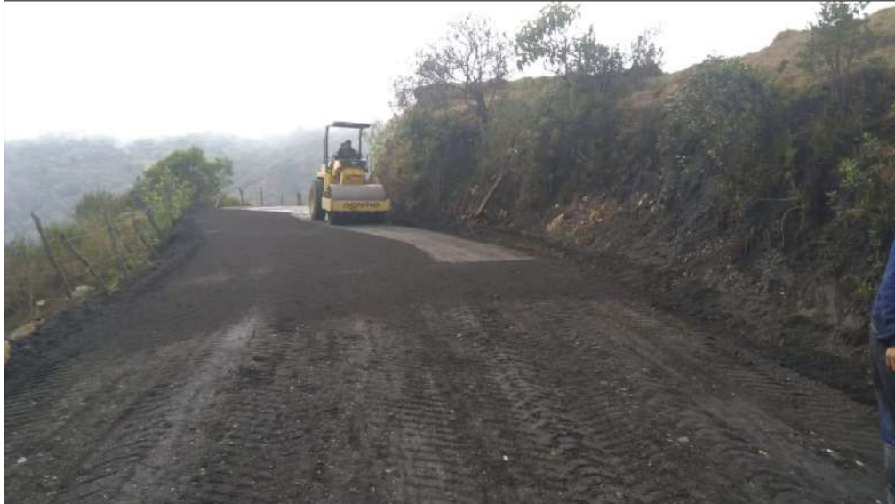
Compactación del material fresado estabilizado con emulsión