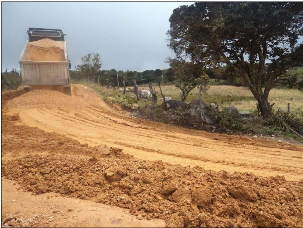
Transporte de material