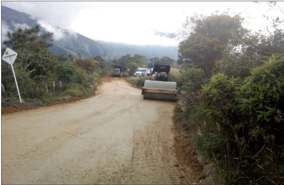
Trabajos de compactación del material.