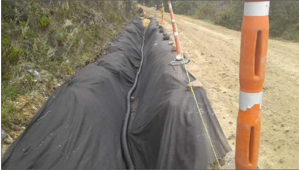
Instalación de geotextil y tubería de drenaje.