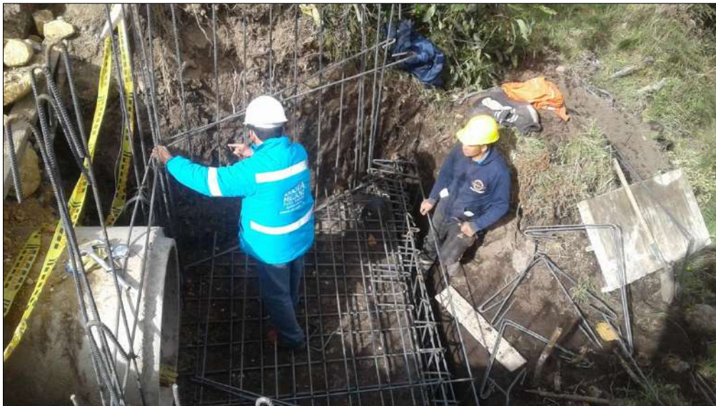
Figuración y armado de acero de refuerzo