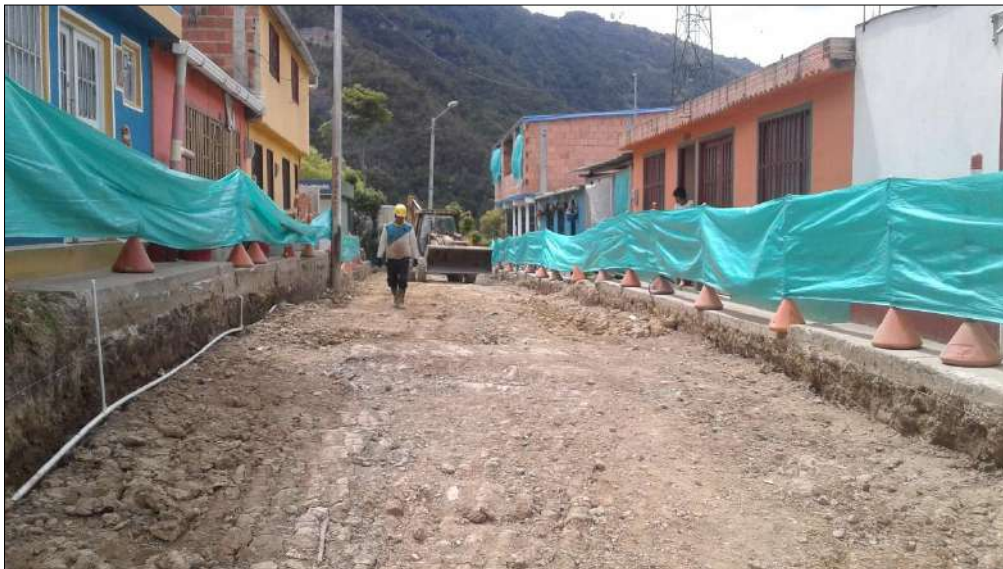
Acometidas instaladas por la comunidad