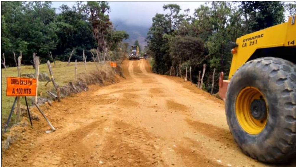
Extendido, nivelación y compactación Subbase B-400.