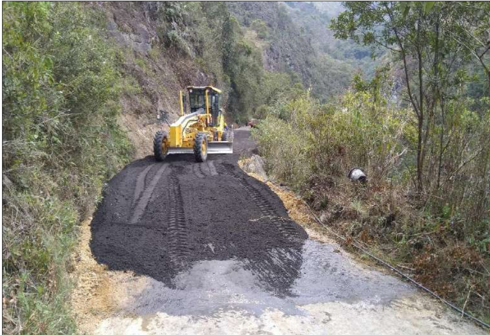
Mezclado del material fresado con la Emulsión