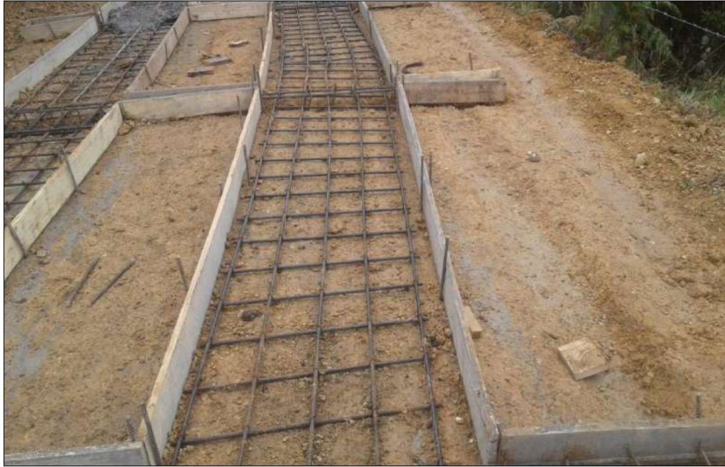
Concretos para las huellas y riostras