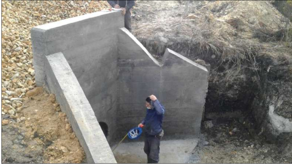
Alcantarilla N°2 descole