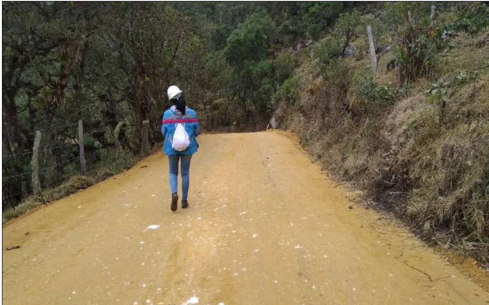
Inspección del componente ambiental.