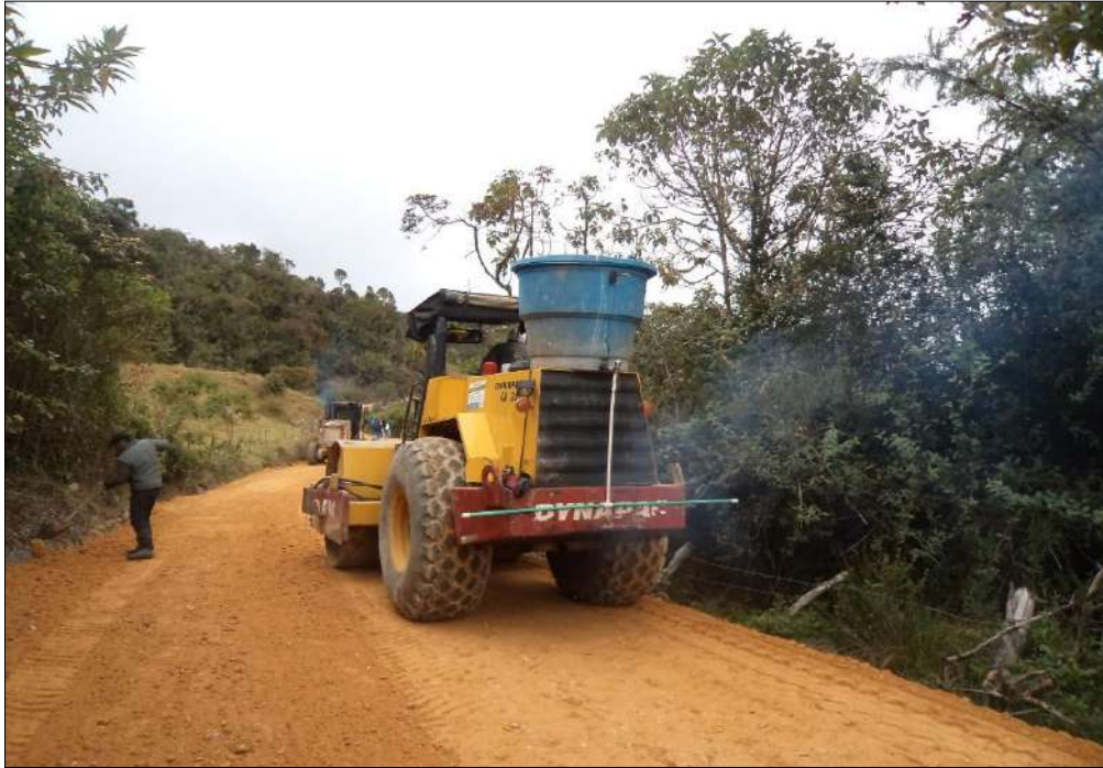
Compactación Subbase B200.