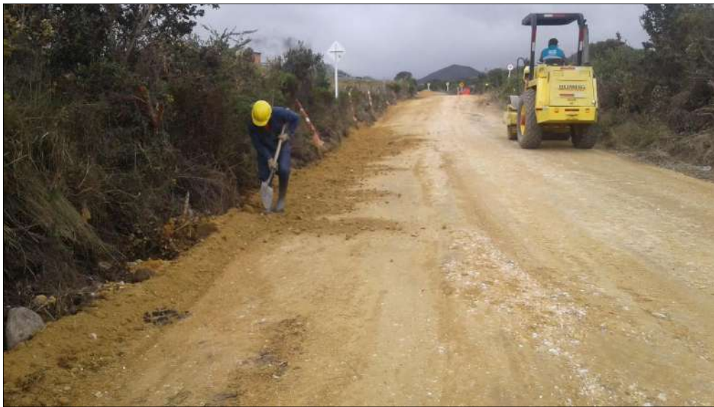
Llenado de b-200