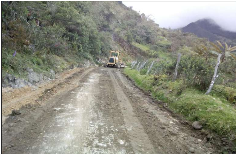
Nivelación y compactación de la subrasante.