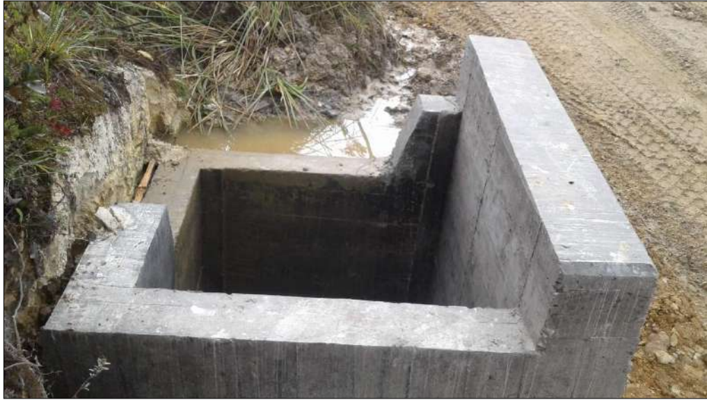
Alcantarilla N°2 Encole