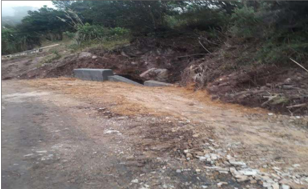
Llenado con material granular