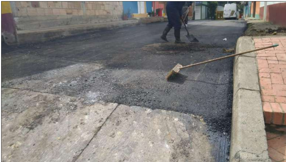
Conformación del material