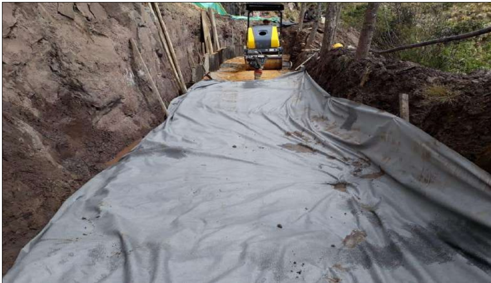
Instalación de geotextil