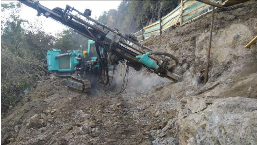
Perforación para los anclajes