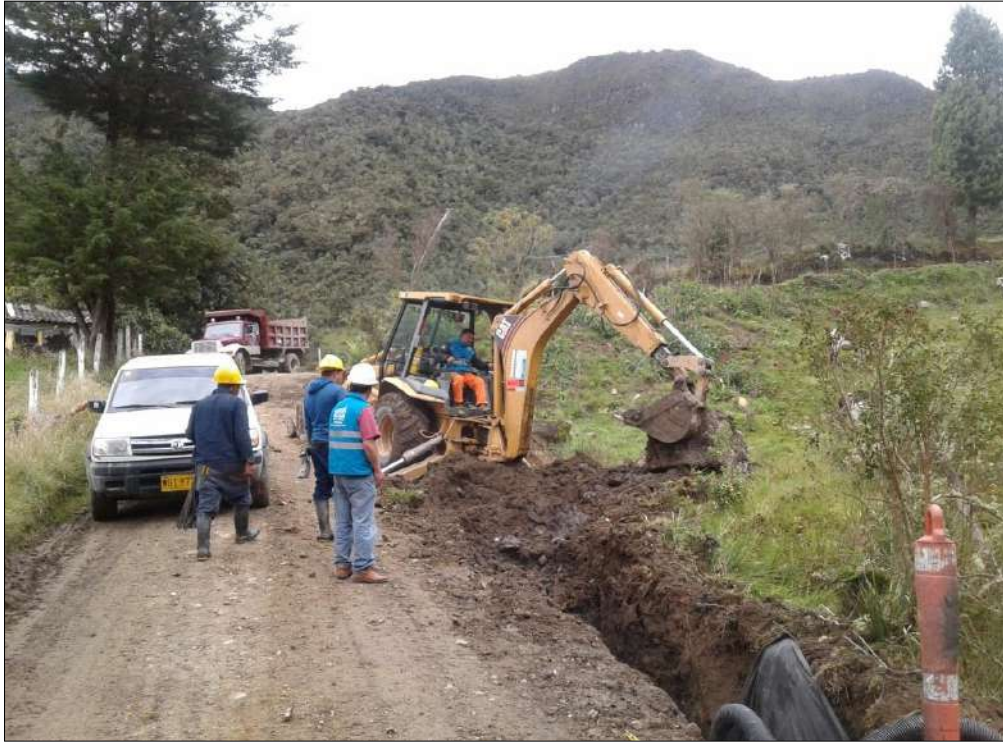
Excavación para los filtros Escuela de Tabaco.