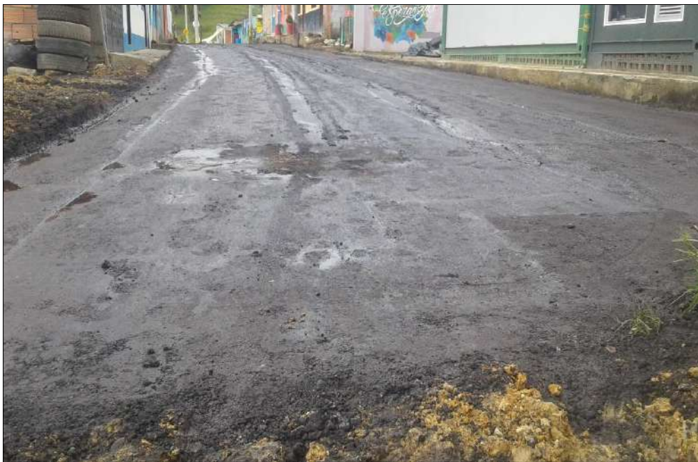
Material saturado (fresado estabilizado con emulsión)