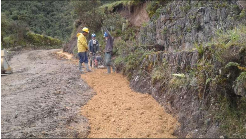
Instalación de material B-200.