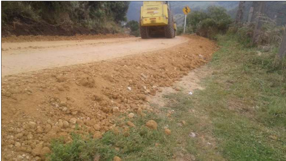
Extendido, Nivelación y compactación del recebo.