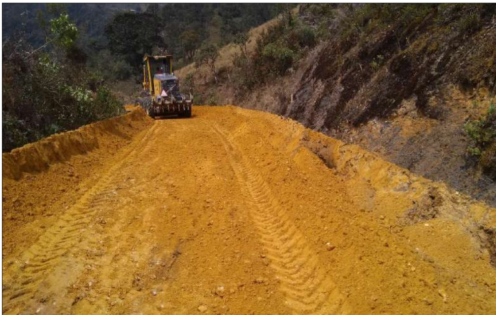
Extendido, nivelación y compactación Subbase B-400.