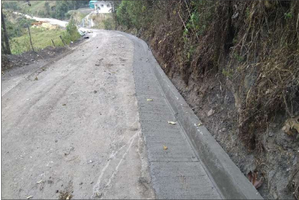
Construcción de cunetas