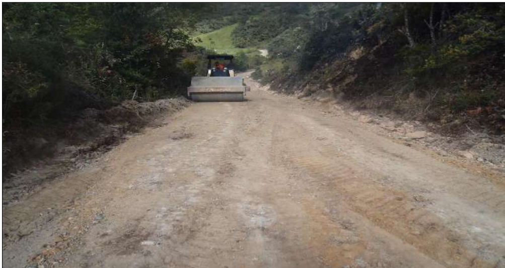
Compactación de la subrasante