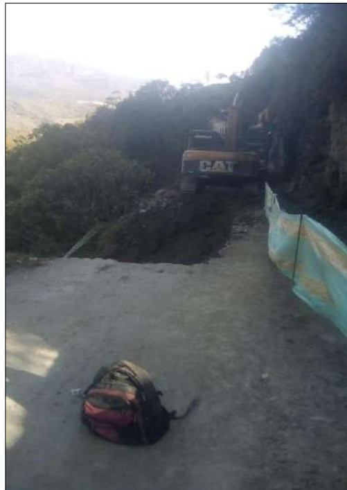
Escavación para el muro de contención