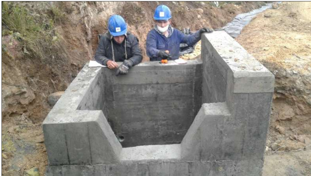
Alcantarilla N°3 Encole