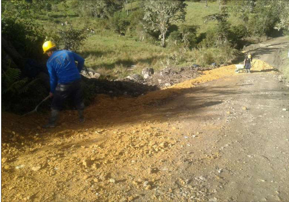
Conformación de material B-200 sobre los filtros