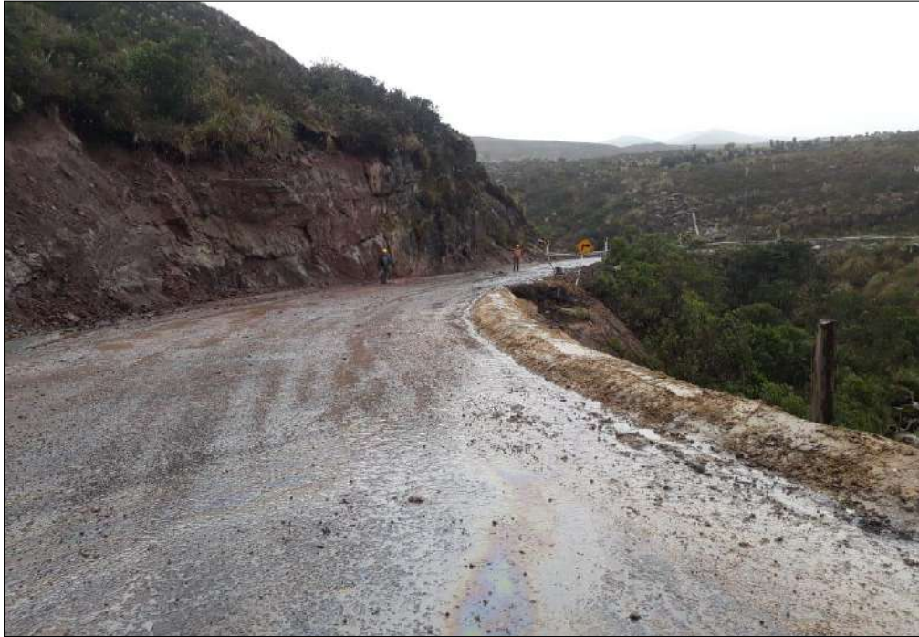
Jarillon en marterial granulare estabilizado con cemento