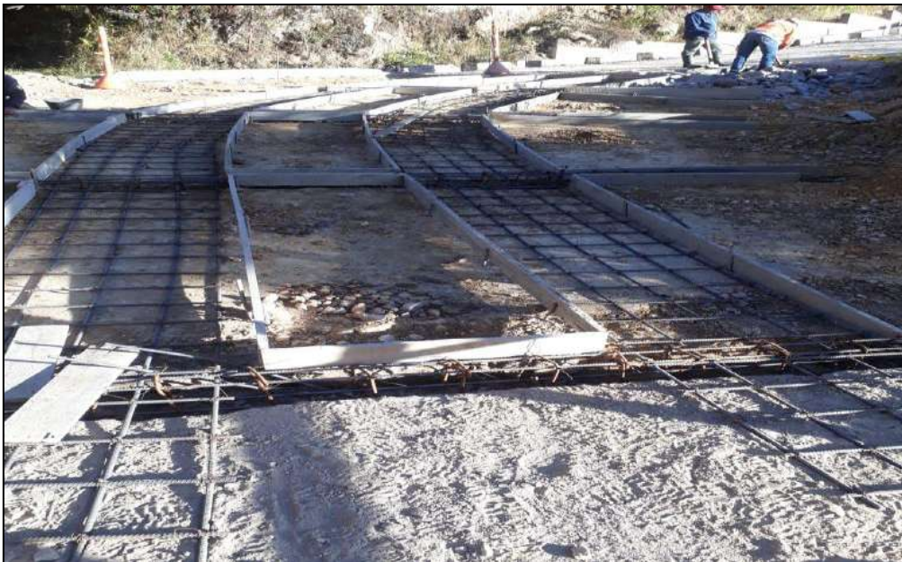
Figurado, Armado del acero de refuerzo y encofrado para placa huella.