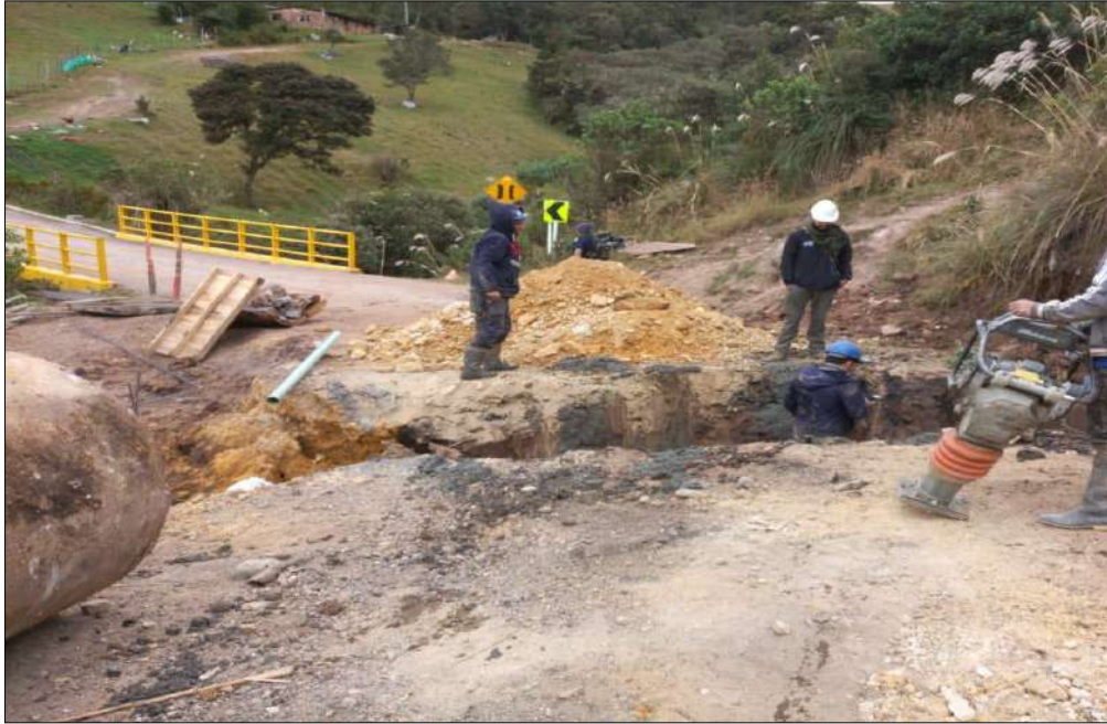
Instalación de tubería y rellenos