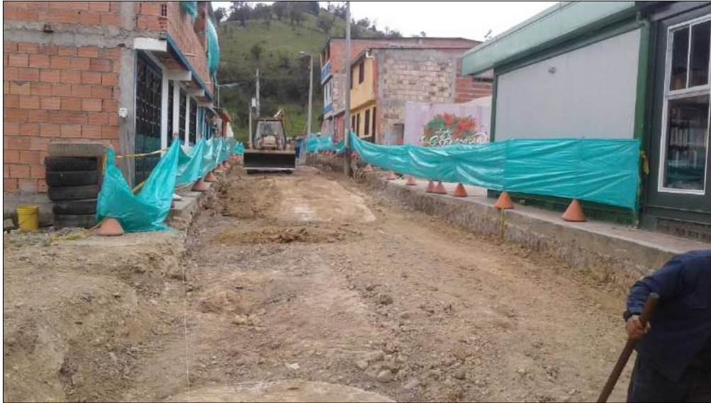
Extendido y nivelación Subbase B200.