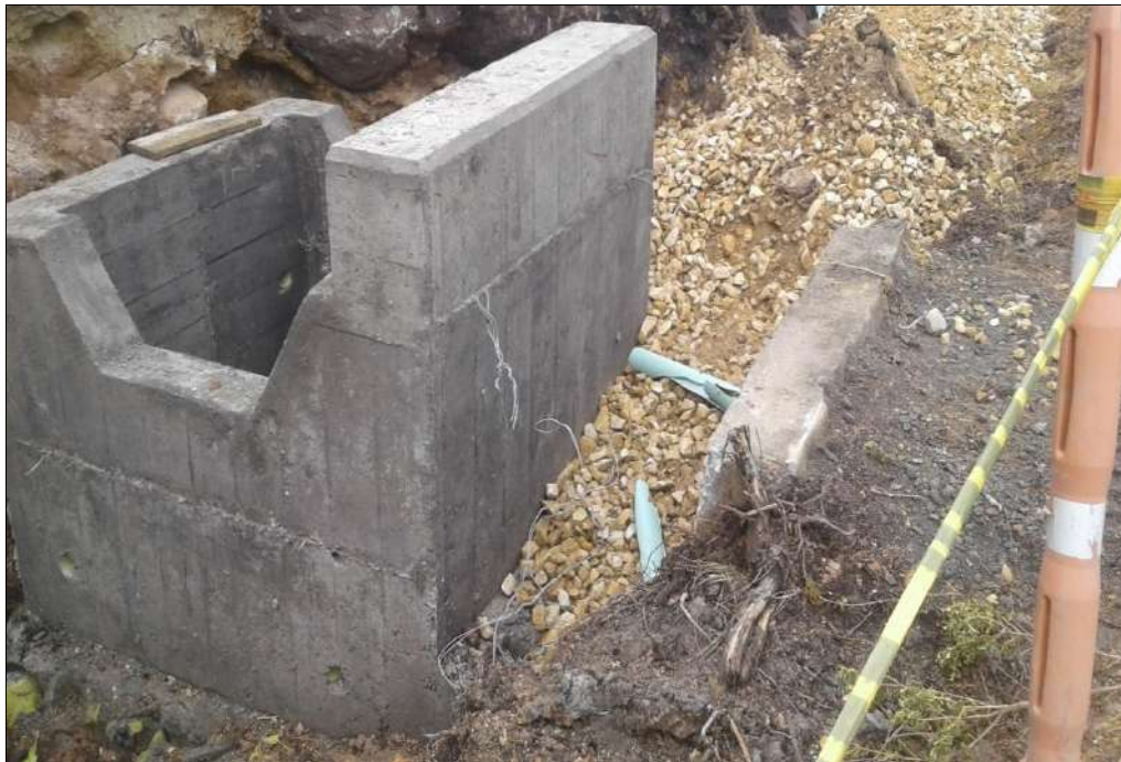
Alcantarilla N°1 Encole