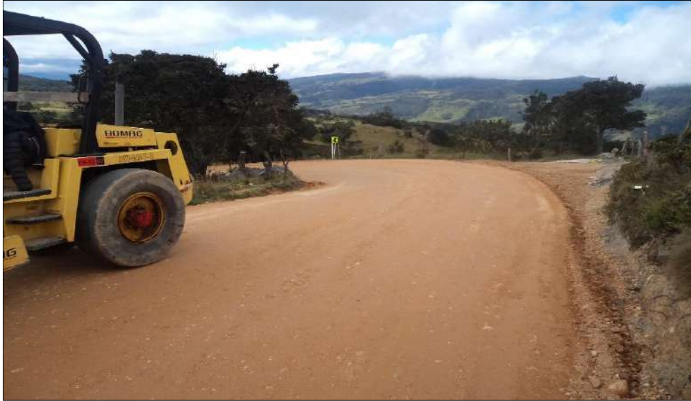
Compactación del material B-400.