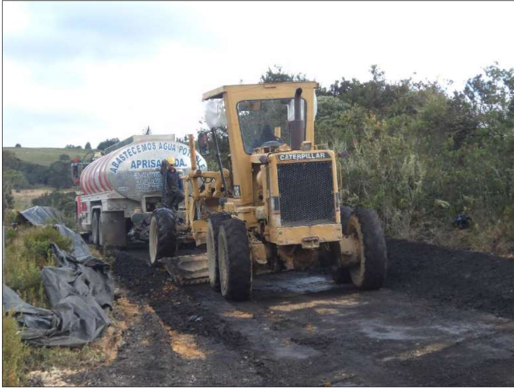
Extendido, Mezclado y nivelación del fresado con emulsión asfáltica