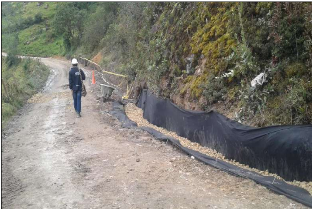
Inspección por parte de la interventoría de la construcción de los filtros.