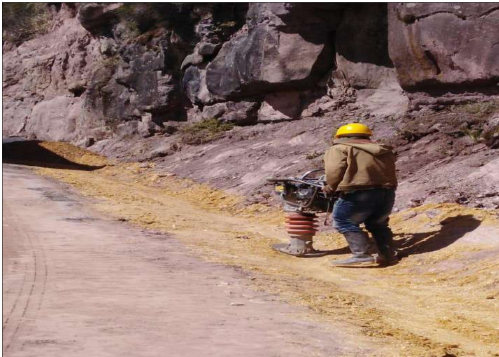
Extendido y nivelación Subbase B200.