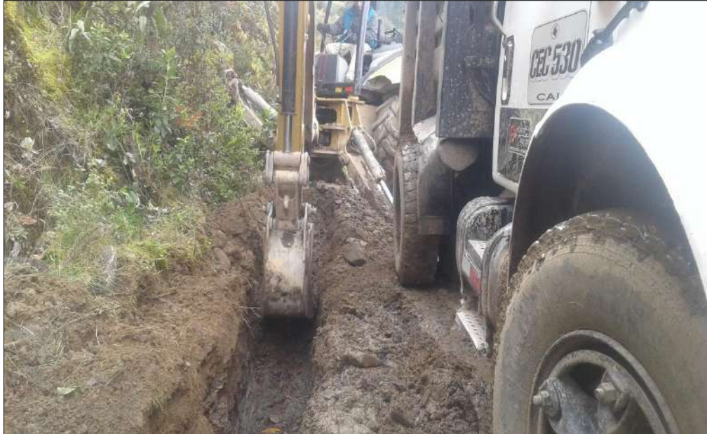
Excavación para los filtros.