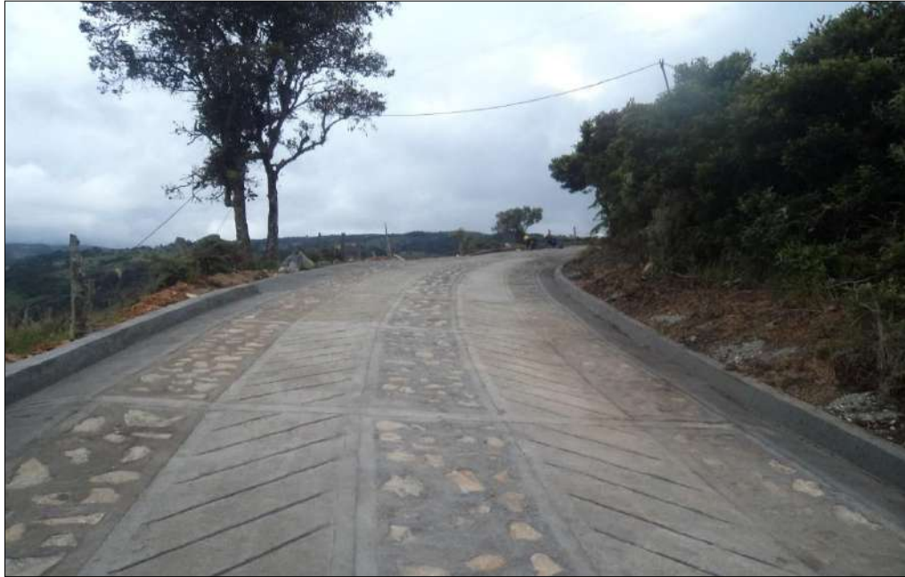
Concreto ciclópeo-placa huella