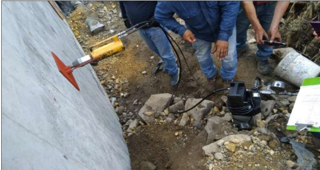
Tensado de los anclajes del muro de contención