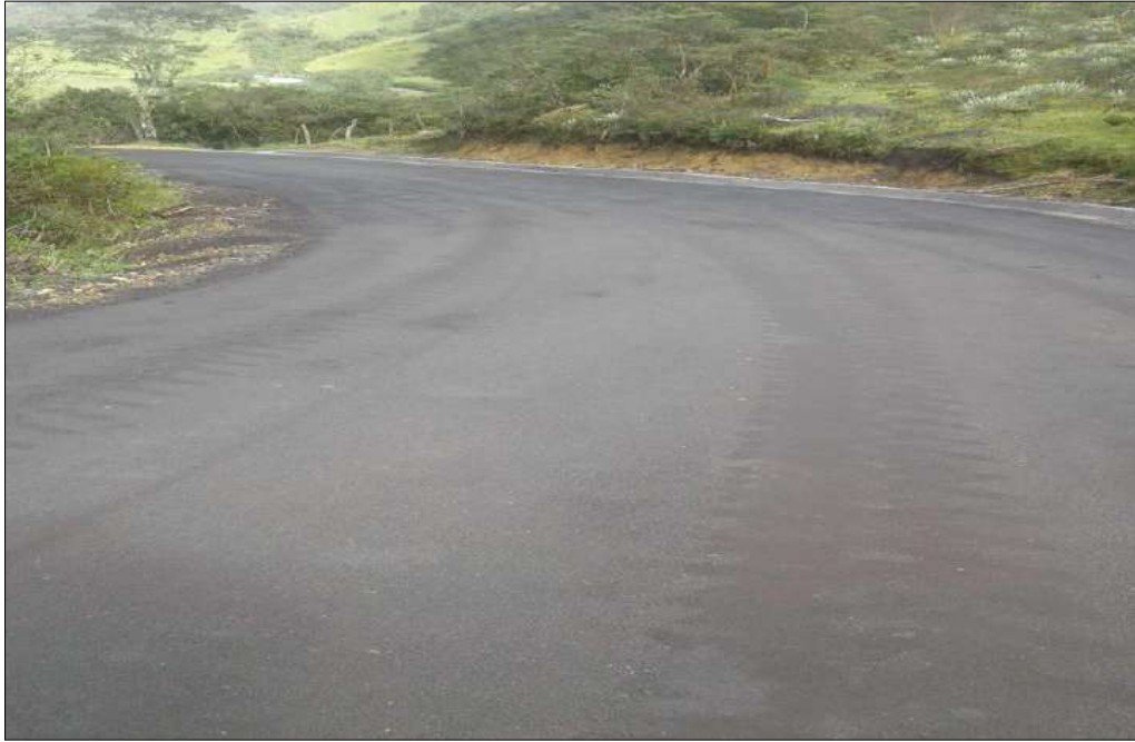
Material fresado estabilizado con emulsión instalado