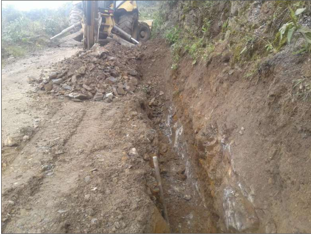
Excavación en roca.