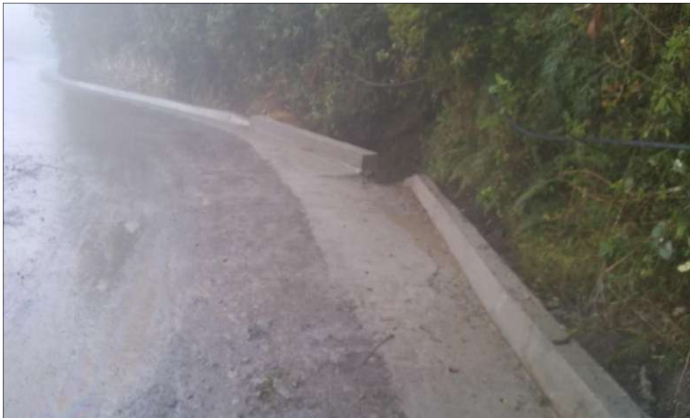
Realización de realces