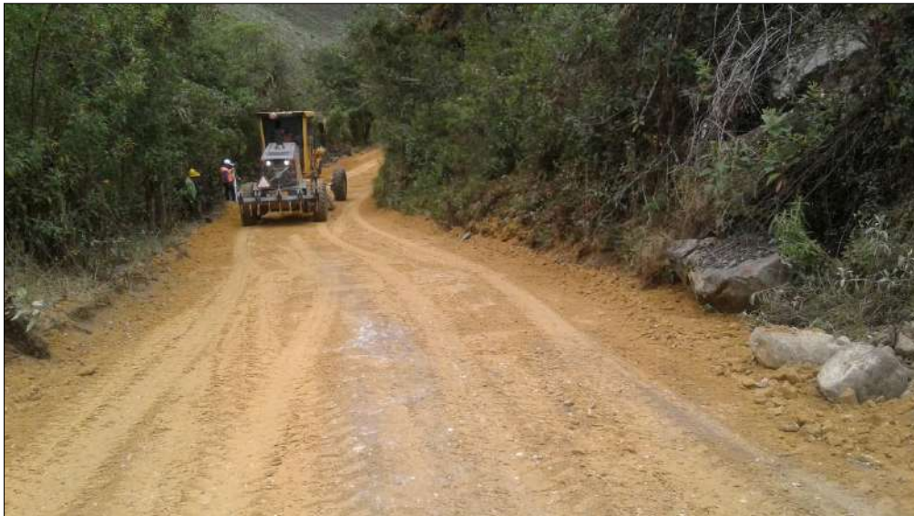
Extendido, nivelación y compactación Subbase B200.