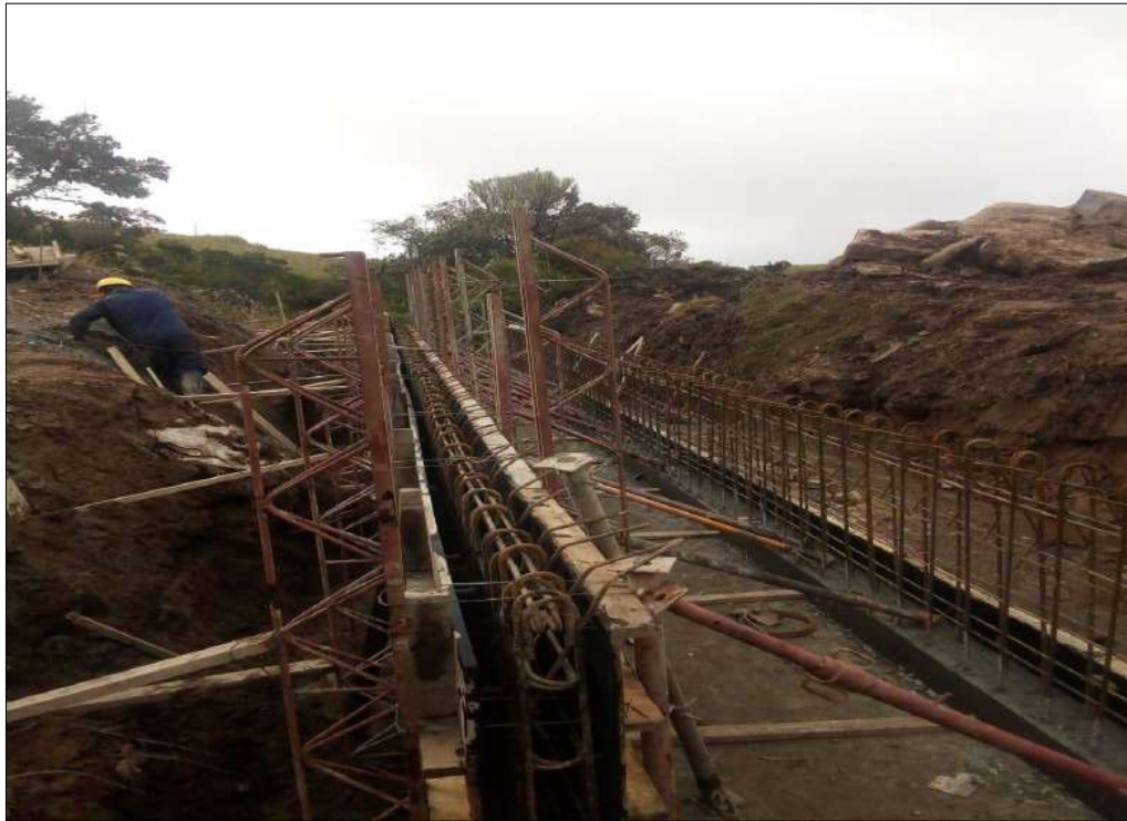
Concretos para el Box culvert