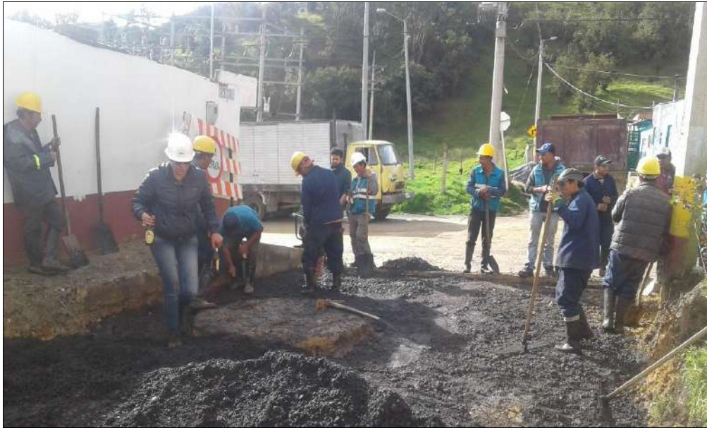
Conformación del material freado estabilizado.