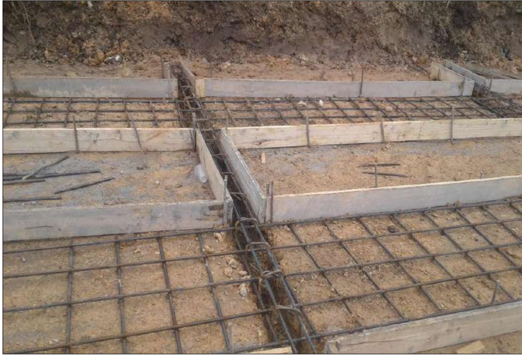
Concretos para las huellas y riostras