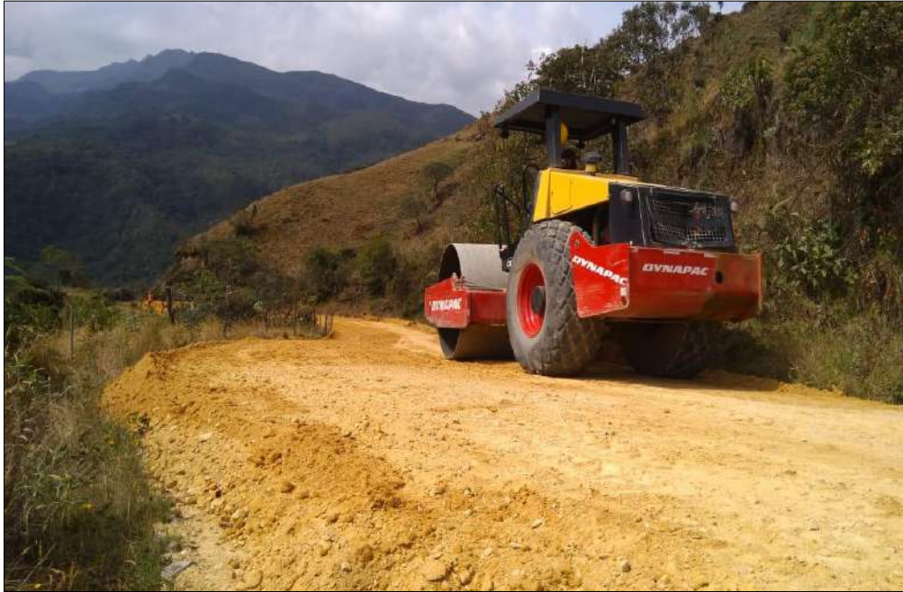
Compactación Subbase B400.