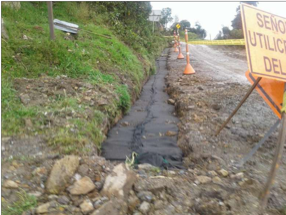
Cosido del geotextil.