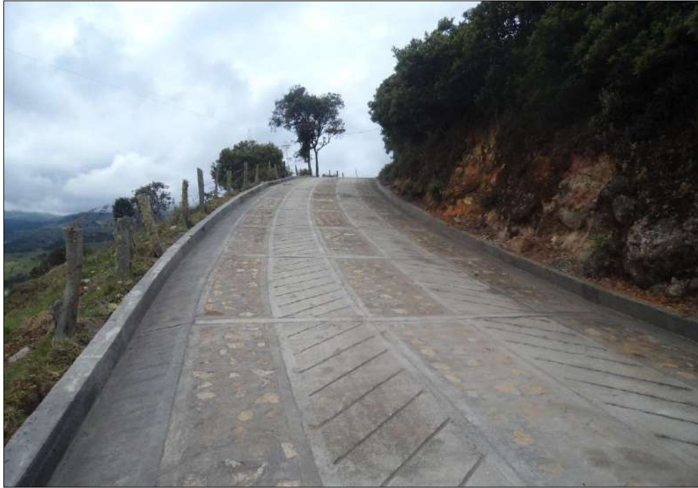
Concreto ciclópeo-placa huella