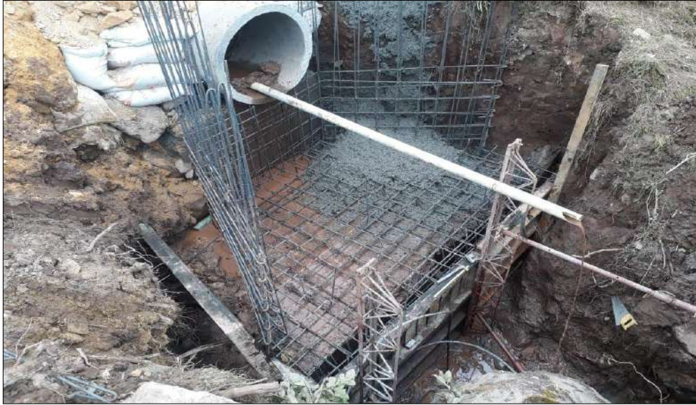
Figurado y armado del acero de refuerzo