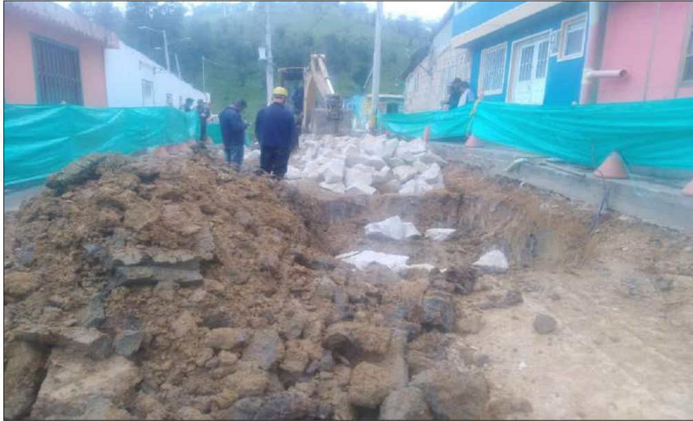
Mejoramiento de la Subrasante con rajón