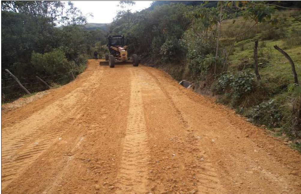
Extendido y nivelación Subbase B400