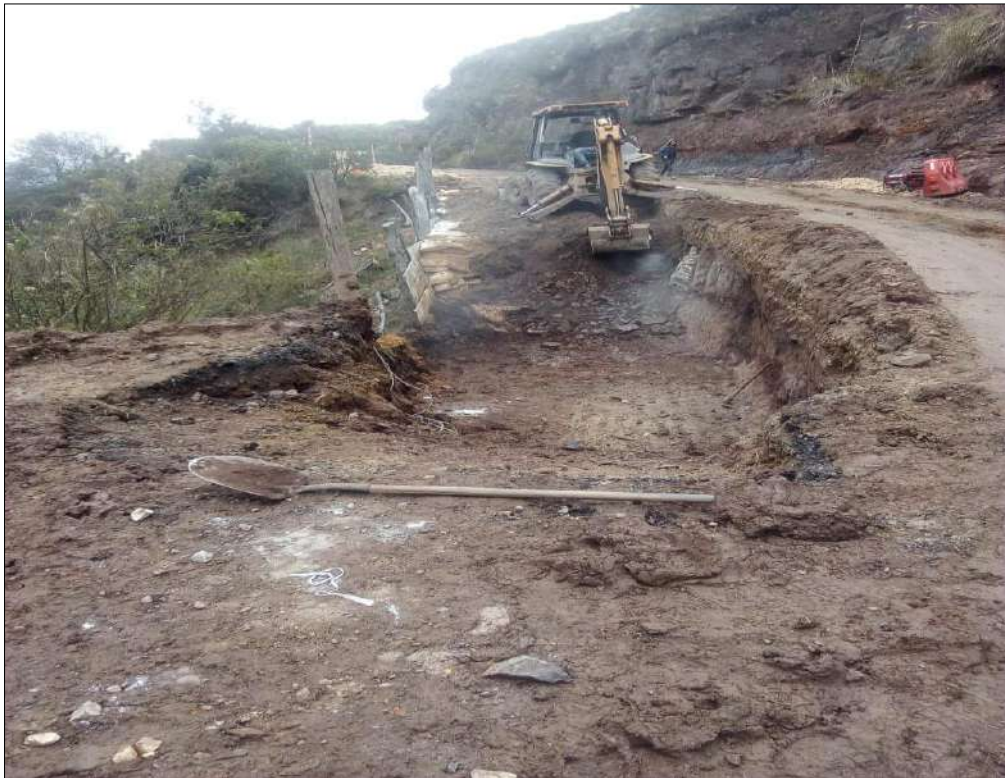
Extendido y nivelación Subbase B200.