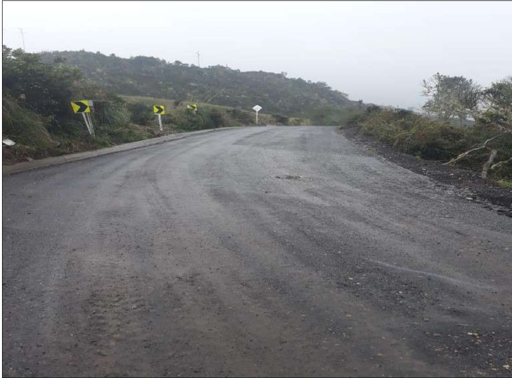
Fresado estabilizado con emulsión instalado