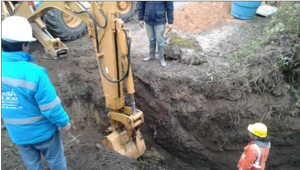
Excavación para la tubería en concreto de 36" Raizal hacia Une-peñaliza