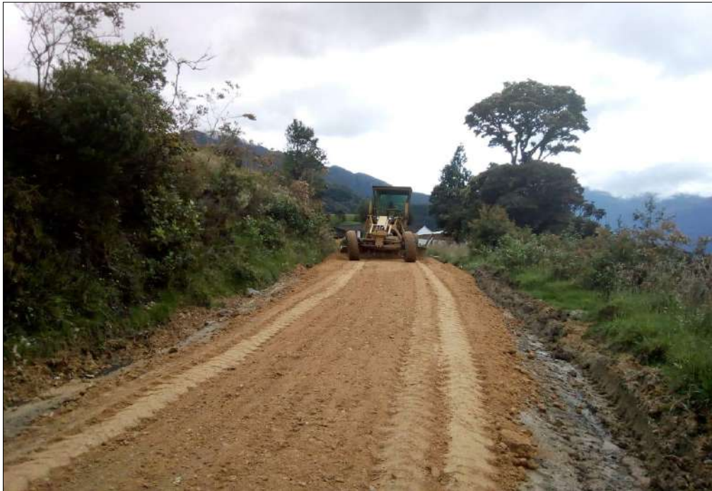
Extendido, nivelación y compactación Subbase B200.