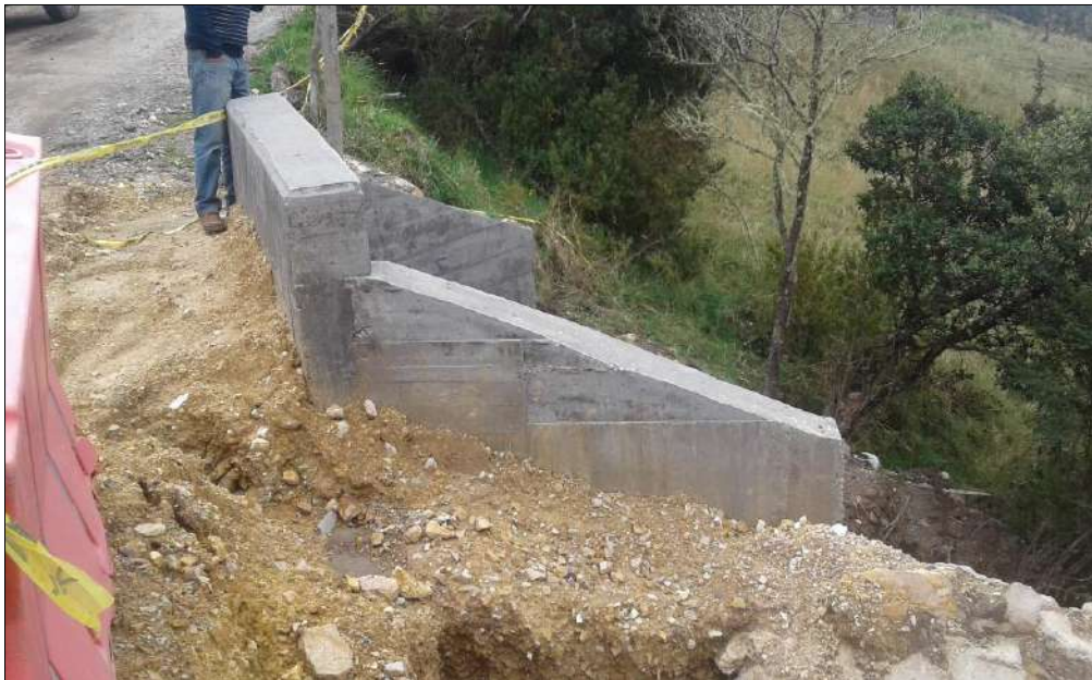
Rellenos con material granular