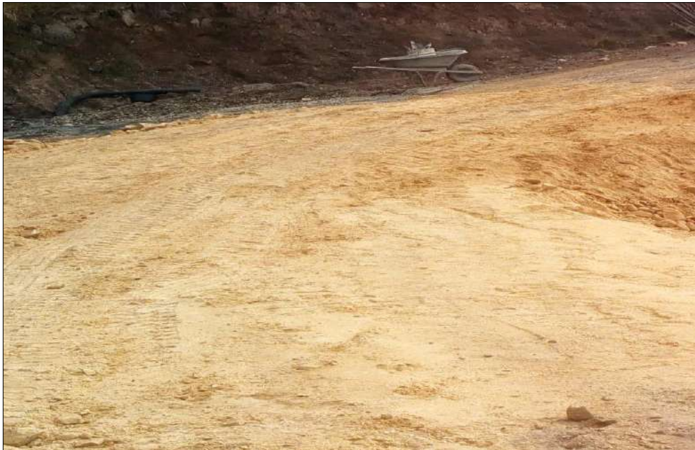
Extendido, nivelación y compactación Subbase B400