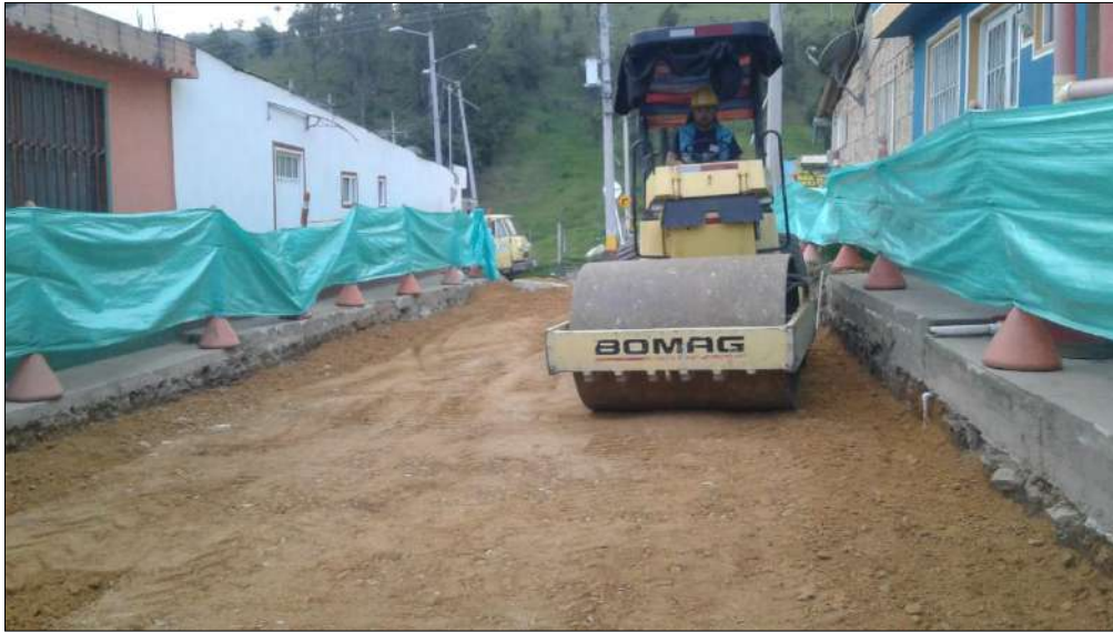
Compactación del material b-200