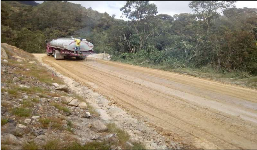
Humedecimiento del material.