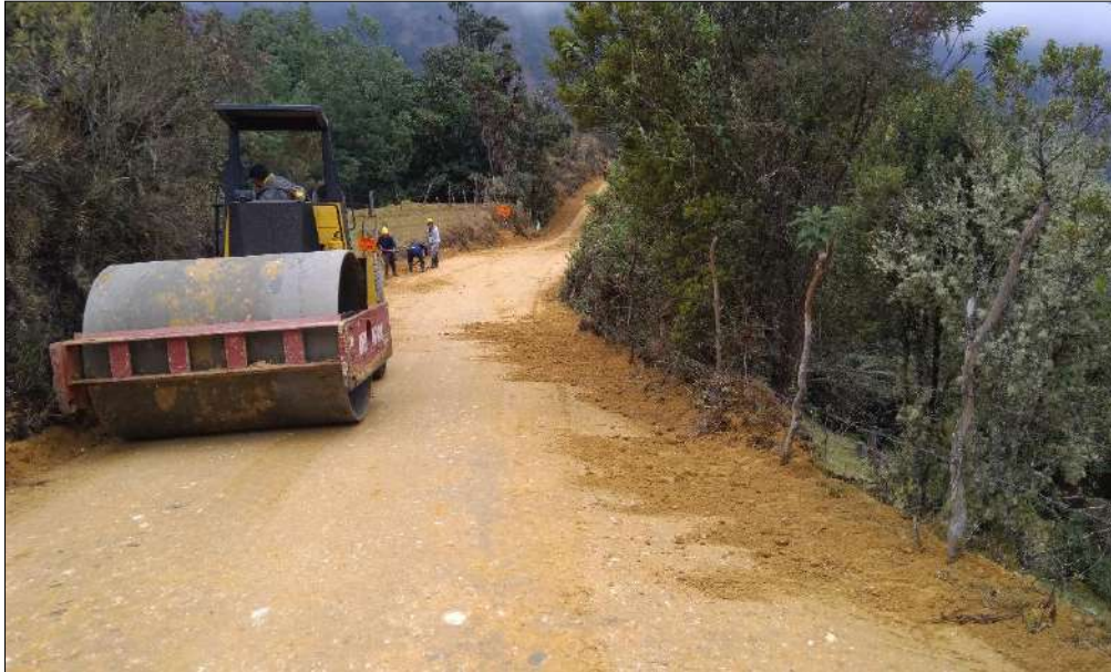
Compactación Subbase B400.