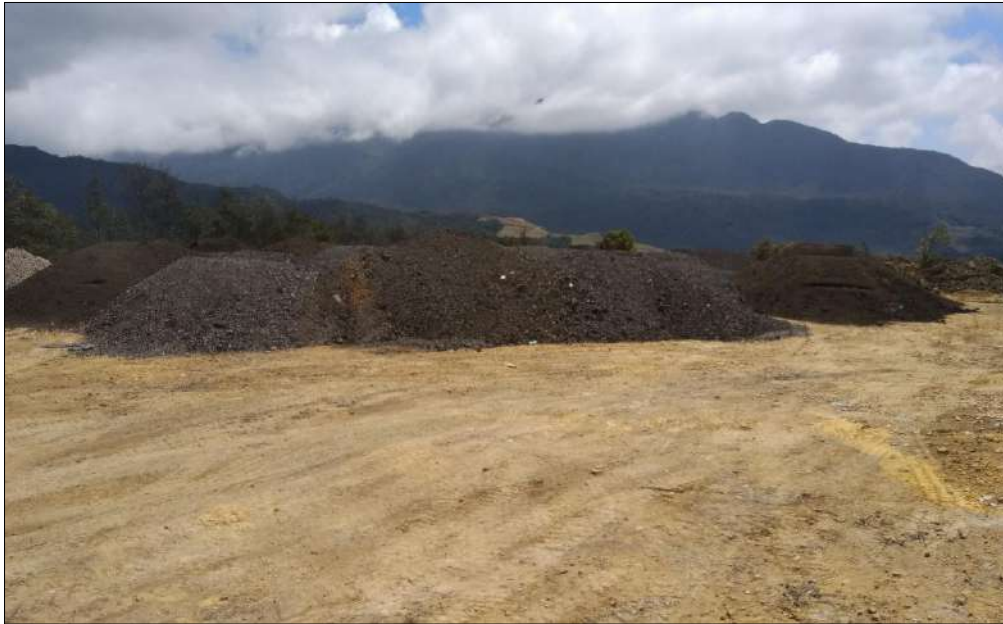
Transporte de materiales