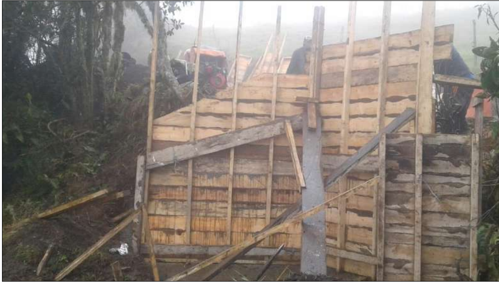
Encofrado para las aletas