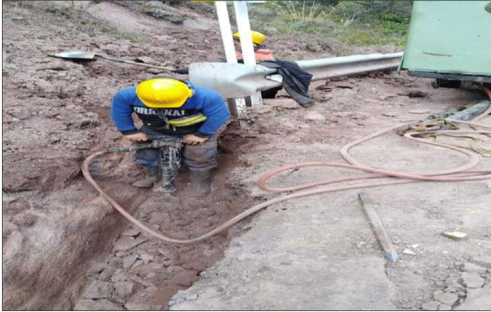
Extendido y nivelación Subbase B200.