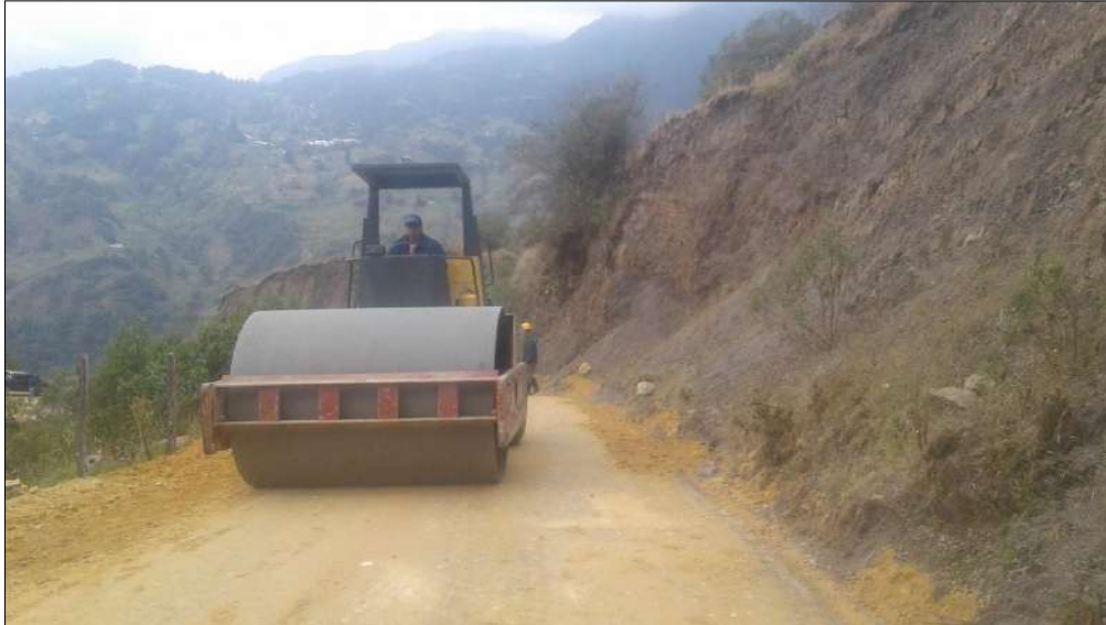
Compactación Subbase B-200.