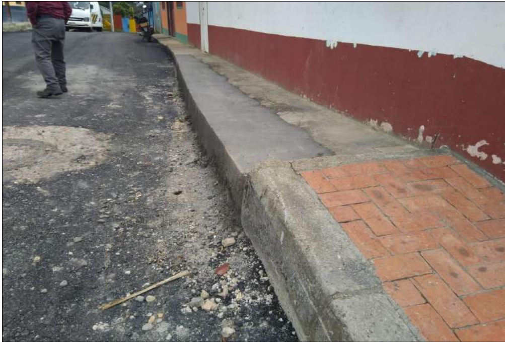
Arreglos de los andenes