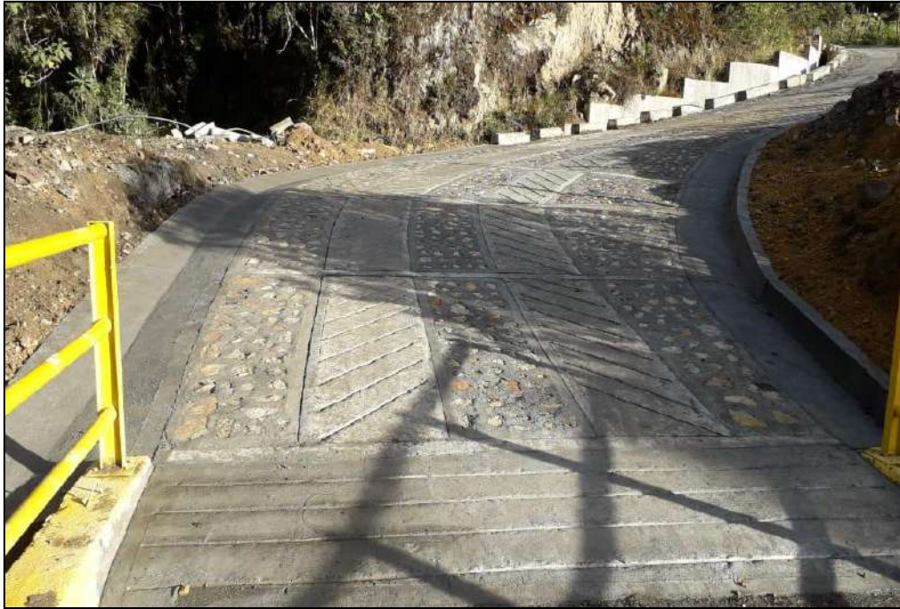
Terminando placa huella.