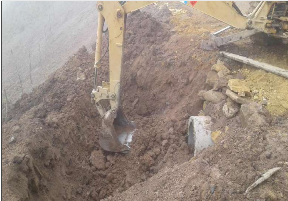
Excavación para la instalcion de tuberia de 36" en concreto