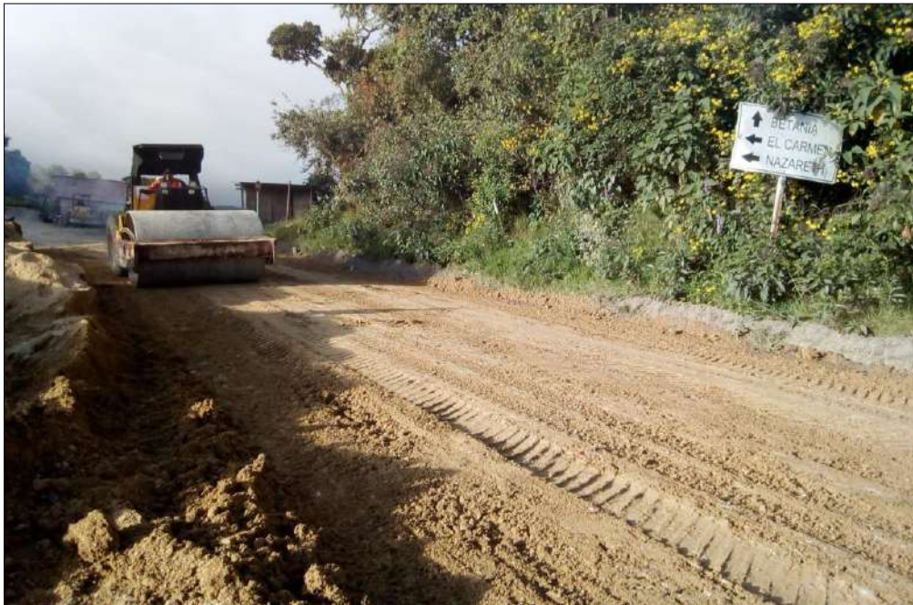
Compactación Subbase B-200.