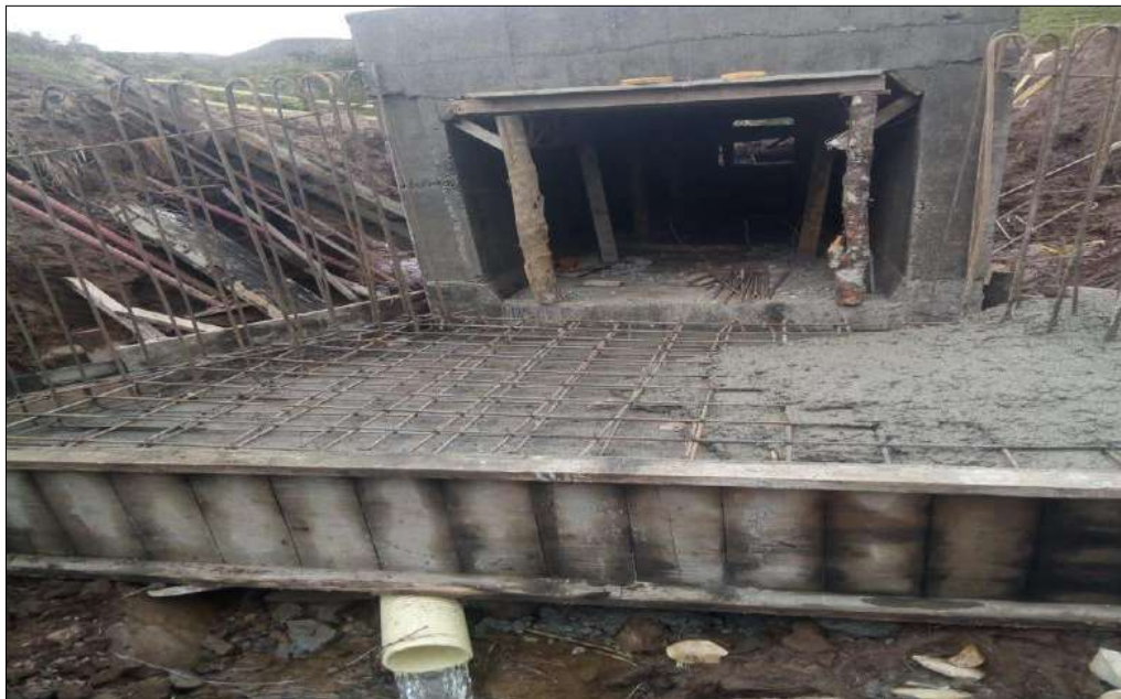
Figurado y armado del acero de refuerzo y fundido de los Encole, descole