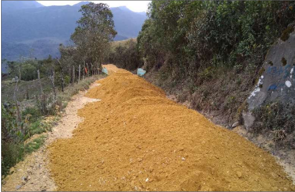
Trasnporte de materiales