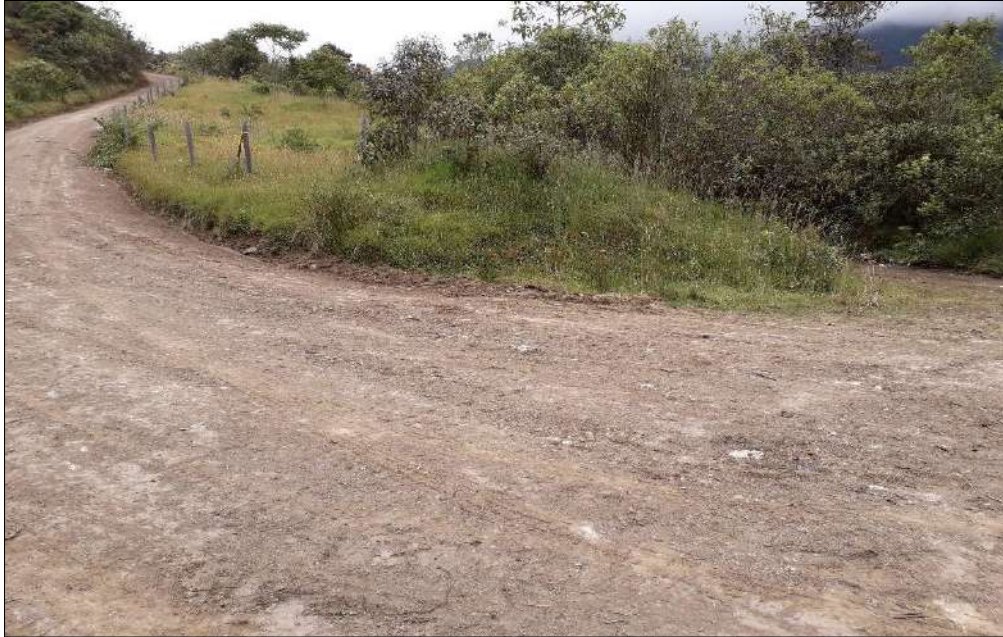
Nivelación y compactación