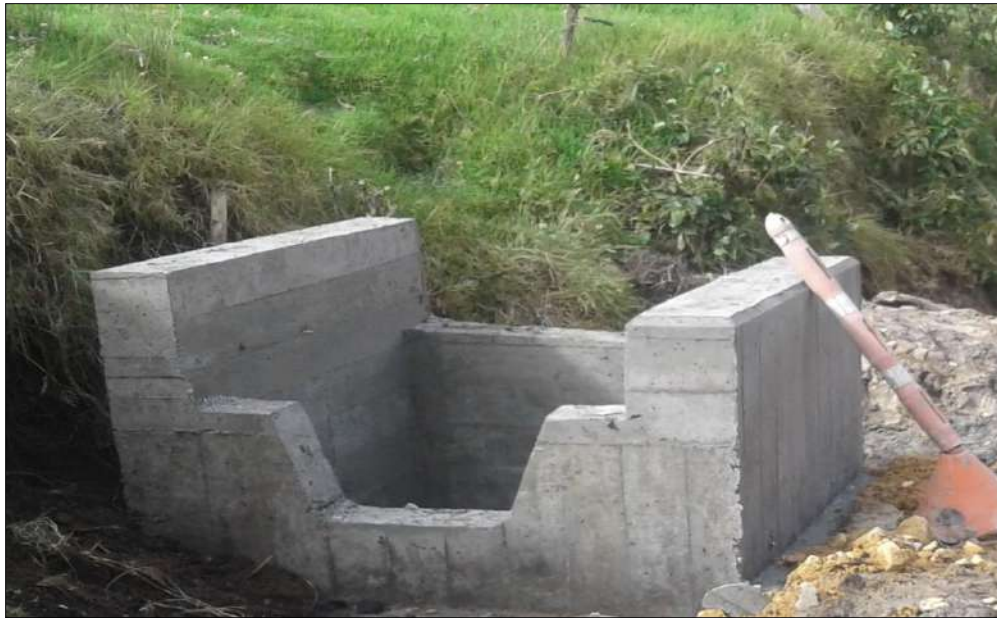
Caja de entrada-curado