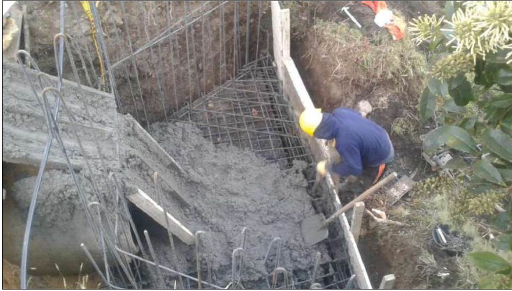
Fundido y vidrado del concreto para las placas y llaves