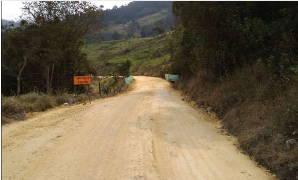
Extendido, nivelación y compactación Subbase B200.