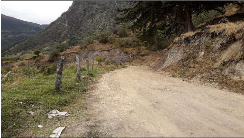
Nivelación y compactación