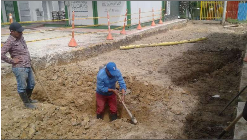
Instalacion de redes por parte de la comunidad