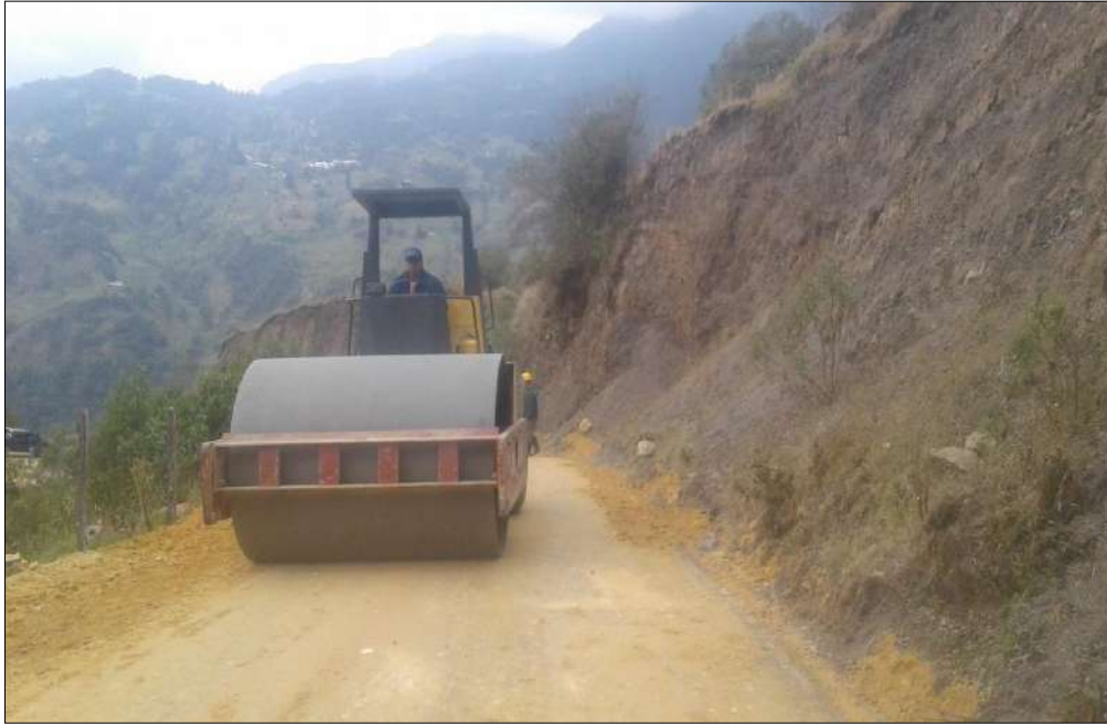
compactación Subbase B400.