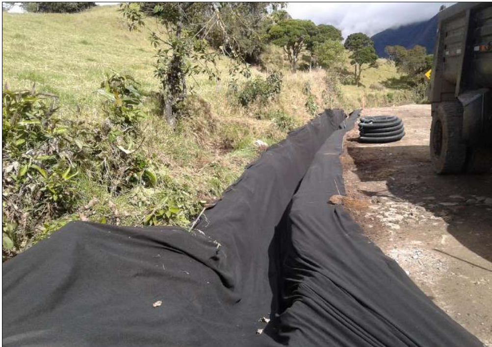
Instalación de geotextil para los filtros