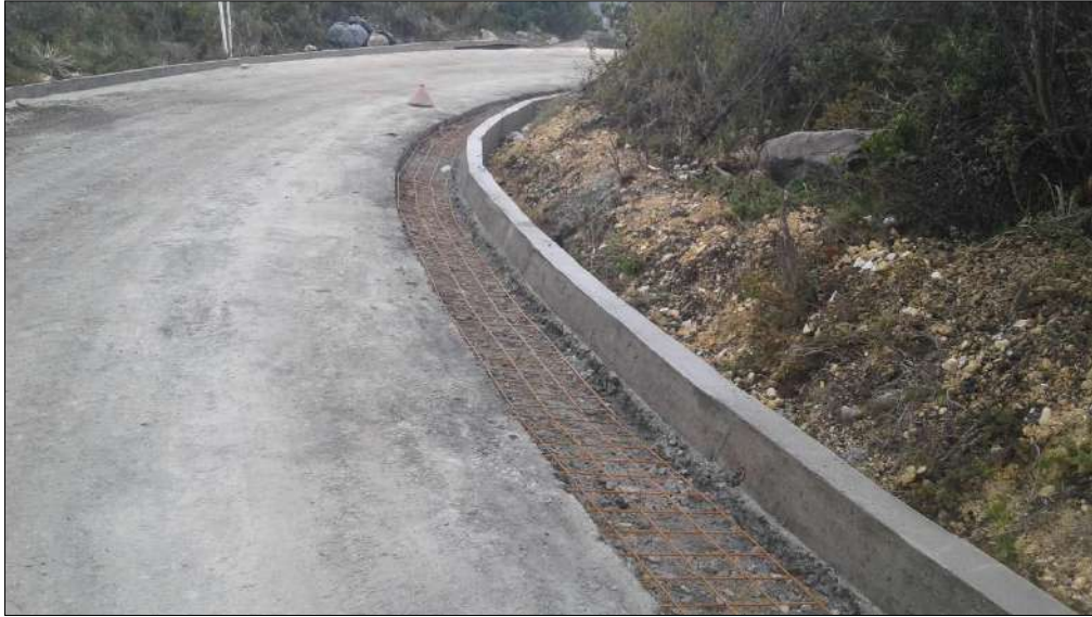
Instalación de malla electrosoldada para las cunetas