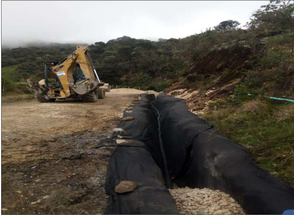
Construcción de filtros