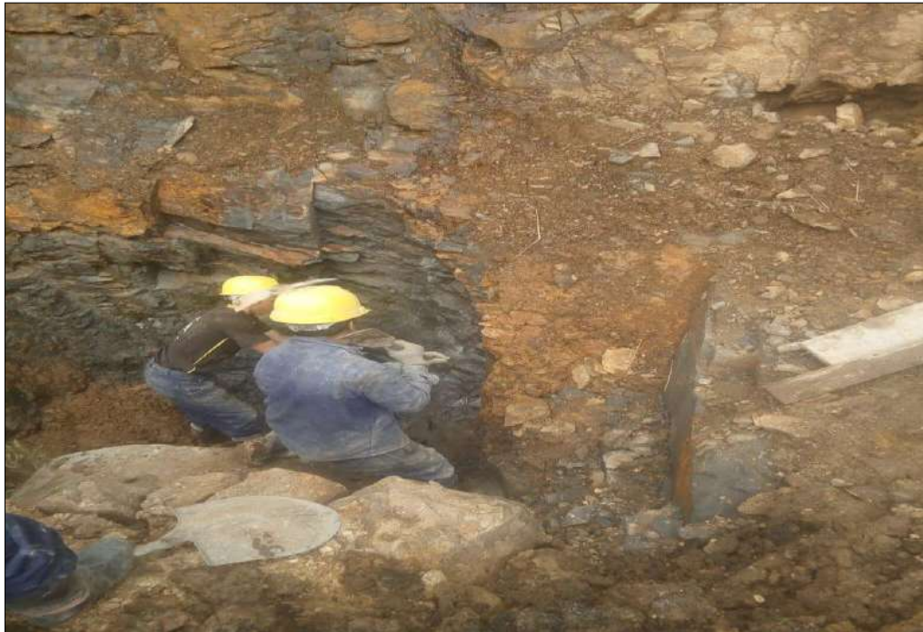
Excavación en roca