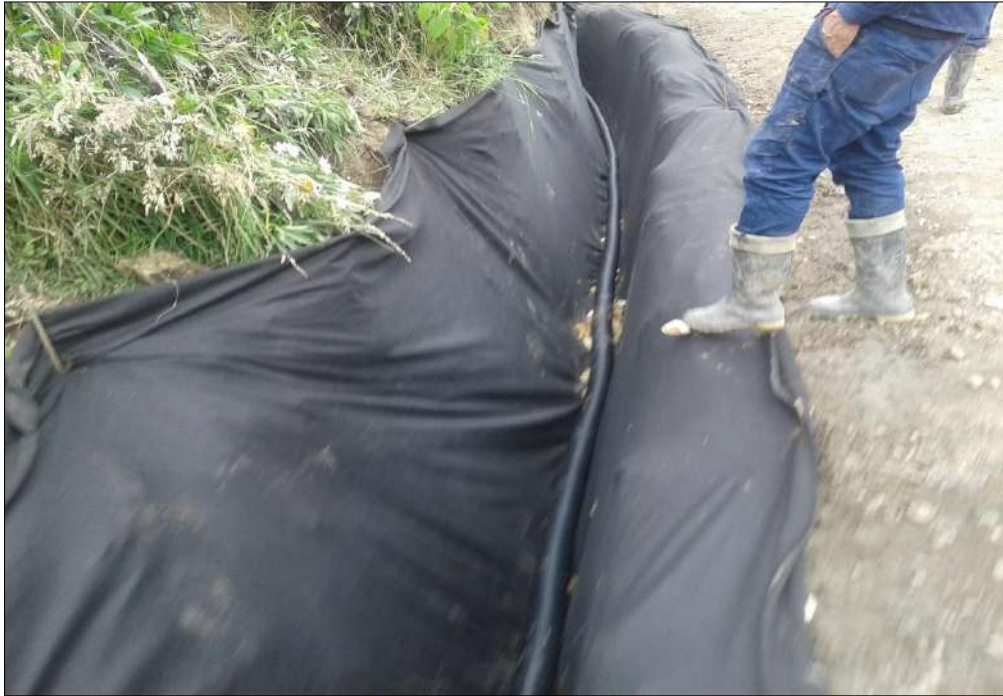
Instalación de Geotextil.