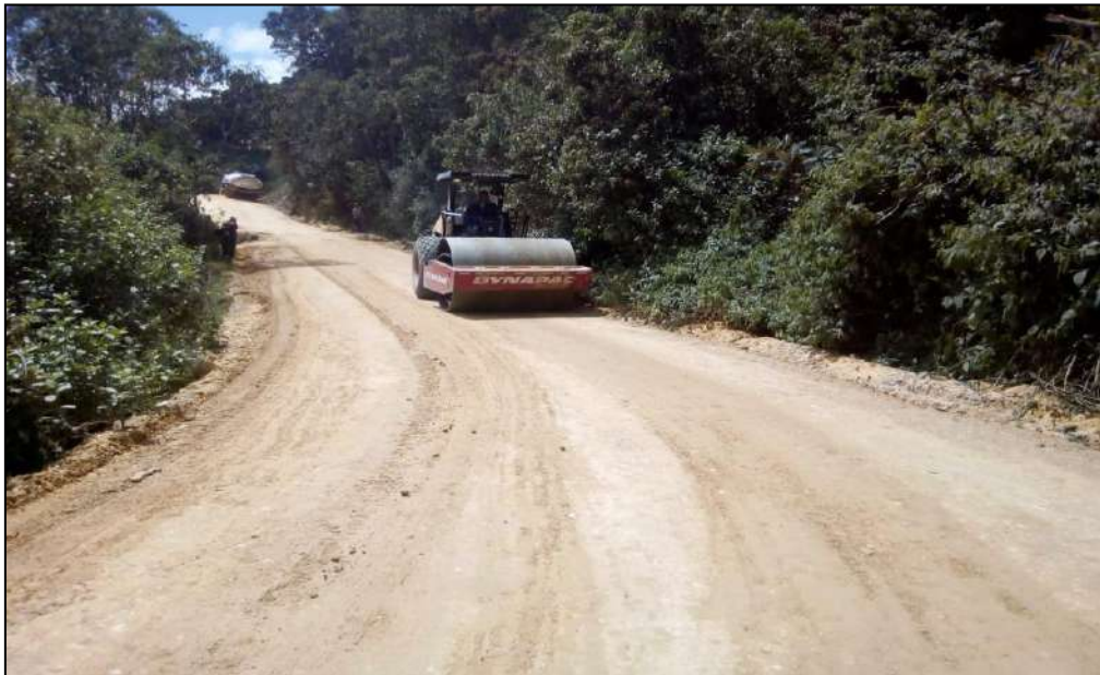
Trabajos de compactación del material.