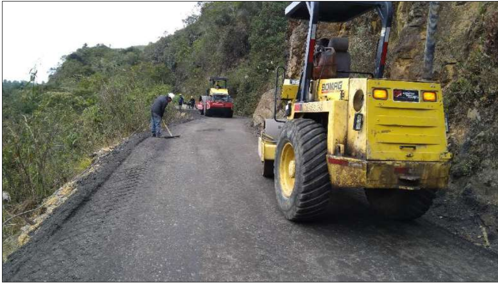
Instalación de fresado estabilizado con emulsión