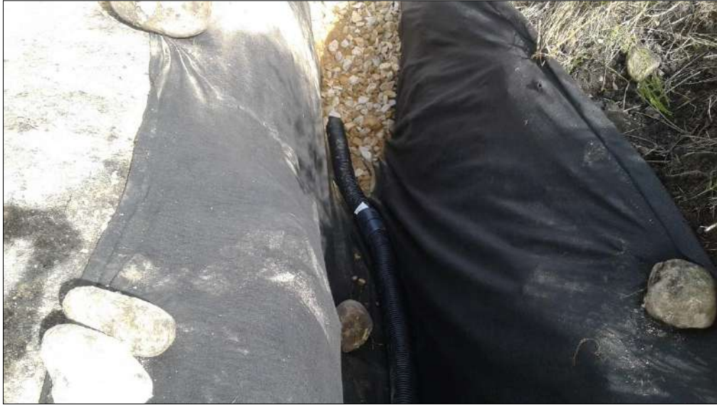
Instalación de material filtro.