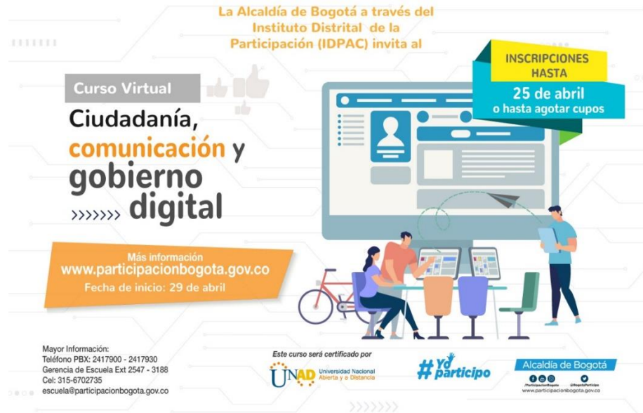
Figura 4- Poster de invitación a curso virtual