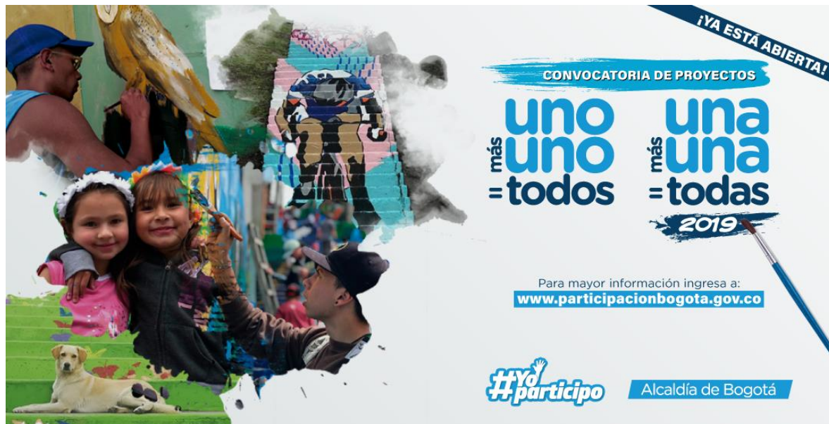
Figura 2- Poster de convocatoria del modelo