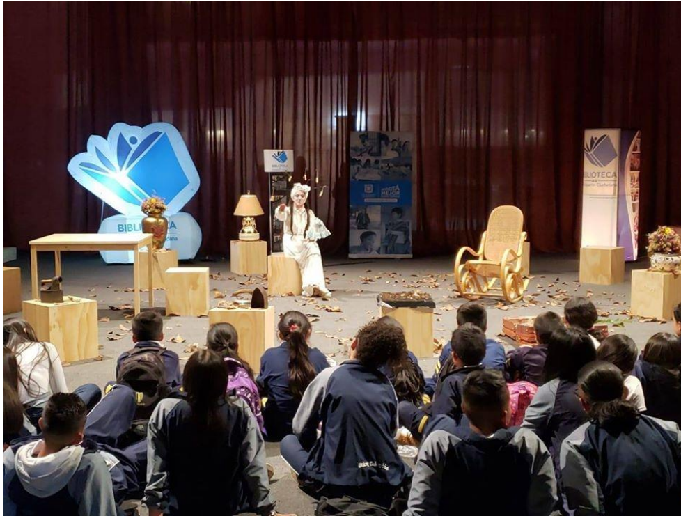
Figura 5- Presentación Cuadro Teatral en la Feria Internacional del Libro de Bogotá 2019.