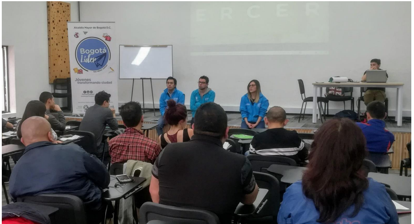
Figura 3- Divulgación de la estrategia Bogotá líder.