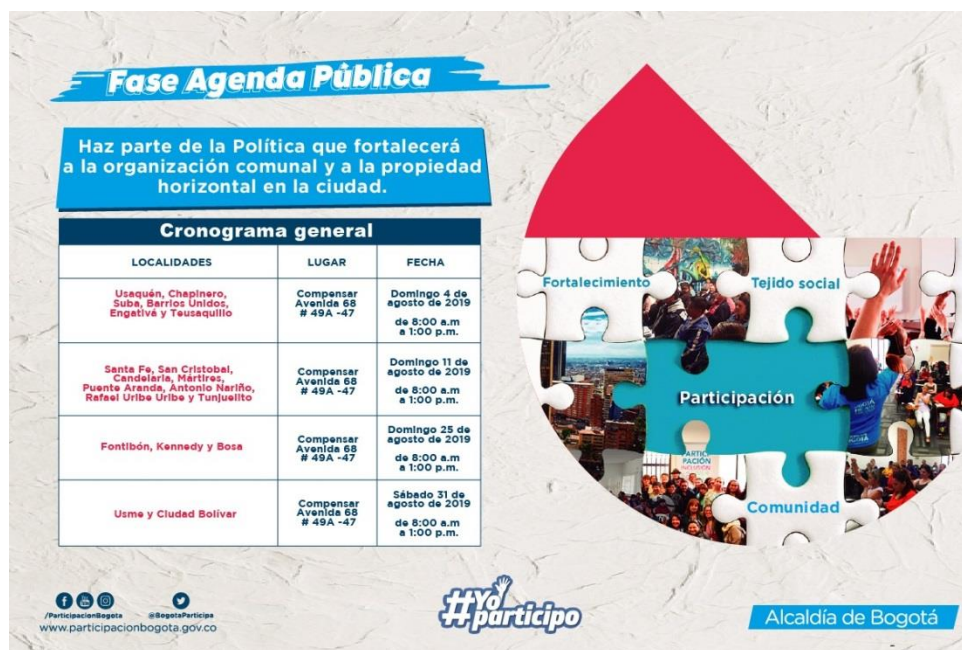
Figura 6- Poster de invitación a jornadas de construcción de política de participación a organizaciones comunales y de propiedad horizontal.